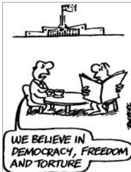
„Wir glauben an Demokratie, Freiheit und Folter.“ Aus „The Guardian“, Sydney

Die Warlords (örtliche und regionale Machthaber mit militärischem Anhang) und andere bewaffnete Parteien, mit denen die „Regierung verhandelt und zusammengearbeitet hat, genauso wie offizielle Vertreter der US-Regierung“, verletzen nach einem Bericht von Human