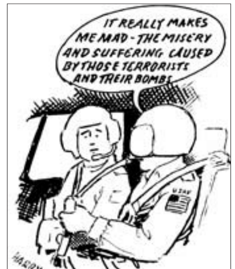
„Es macht mich richtig verrückt – das Elend und Leid, das jene Terroristen mit ihren Bomben verursachen.“ Aus „The New Worker“, London