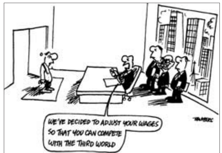
„Wir haben beschlossen, Eure Löhne anzupassen, damit sie mit denen der Dritten Welt konkurrieren können.“