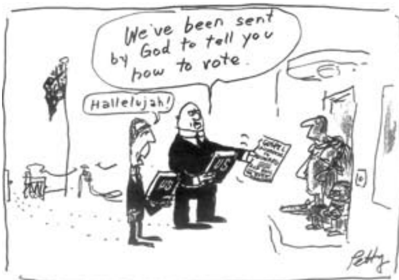
„Halleluja!“ „Wir sind von Gott gesandt, um Ihnen zu sagen, wie Sie wählen sollen.“ Aus „The Guardian“, Sydney

Heute ist die polnische Intelligenz die zahlenmäßig bedeutendste und beruflich einflußreichste gesellschaftliche Schicht, die sogar geschlossener, fester und intensiver als die Intelligenz der Zwischenkriegszeit auf bourgeoisen Positionen steht. Das erschwert zusätzlich den Kampf um eine fortschrittliche Alternative. Der Rechtssieg bei den jüngsten Wahlen hat es erneut gezeigt.