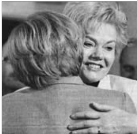
Demonstrative Umarmung von Merkel und der Revanchisten-Führerin Steinbach (beide CDU)

rig Schindluder getrieben wird. Diese 143 Dekrete des Präsidenten der Republik, die auf jeweiliges Ersuchen der von den Alliierten anerkannten tschechoslowakischen Exilregierung mit Sitz in London erlassen worden waren, sind von der Tschechoslowakischen Nationalversammlung mit Verfassungsgesetz 57/1946 Sb. am 28. März