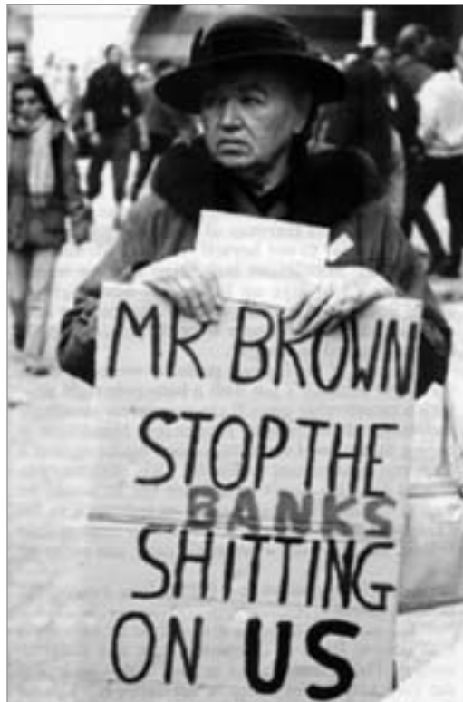
Mr. Brown, setzen Sie dem Beschiß durch die Banken ein Ende!

Die Bestrebungen, ihn aus dem Amt zu katalpultieren, wurden nicht zuletzt durch Blairs in der Regierung verbliebene Gewährleute wie Arbeitsminister James Purnell und die Ministerin für Örtliche Verwaltung Hazel Blears, die beide unter scharfer Distan-