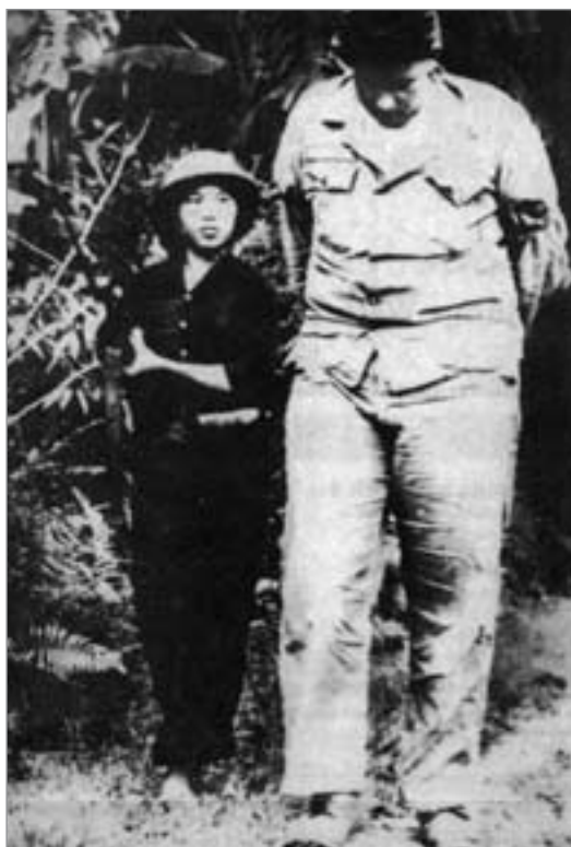
David und Goliath: Durch die Südvietnamesische Befreiungsfront abgeschossener US-Bomberpilot

zusammendrängten, in einen der letzten Helikopter zu gelangen. Abgesehen vom Transportmittel erinnerte die Szene an das Bild der russischen Weißen, die 1918 an Bord eines der letzten Schiffe zu kommen versuchten, die den Hafen Odessa verließen. Auch in diesem Fall war ein imperialistisches Unternehmen mit dem Ziel, die Geschichte zurückzudrehen, am Volk gescheitert.