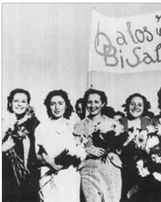
Selbstbewußte Frauen des republikanischen Spanien