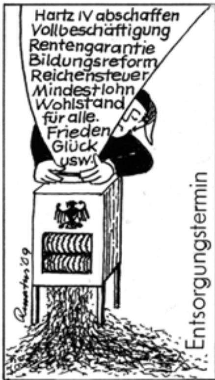
Zeichnung: Renatus Schulz