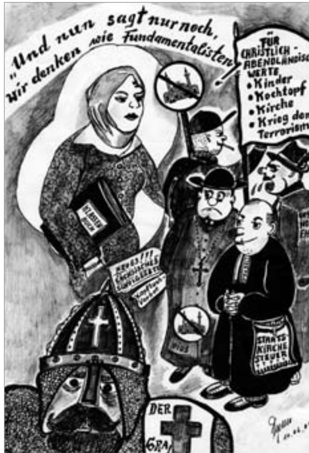
Zeichnung: Heinrich Ruynat

Zeit seines frühgeschichtlichen, von der Bibel erzählten Zuges aus Ägypten in das „Gelobte Land“, nach Palästina. Der Name Israel wurde bekanntlich 1948 durch die UNO als „Heimstatt“ des den Juden eingerichteten Staates übernommen, nachdem sie in dieser Region zuvor über Jahrhunderte eine ethnisch nur wenig bedeutsame Minderheit gewesen waren.