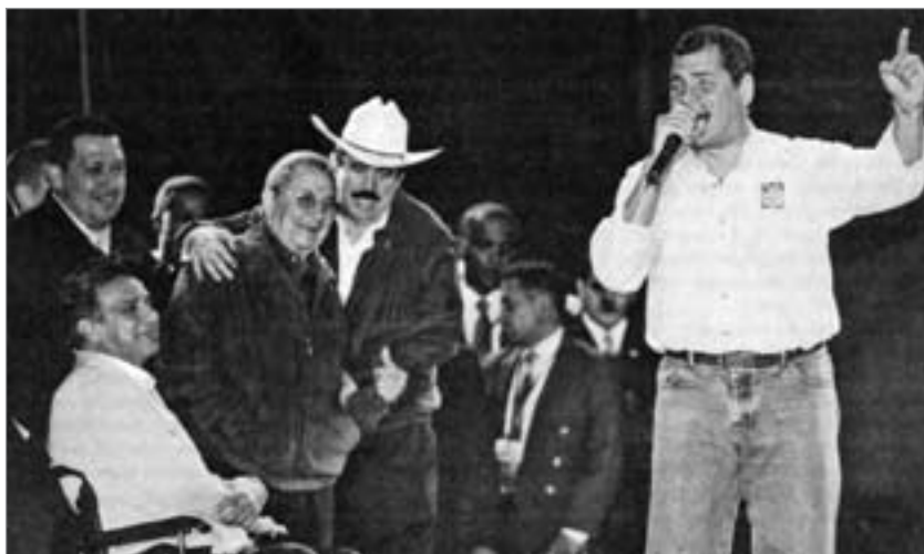
Ekuadors frisch vereidigter Präsident Rafael Correa spricht im Beisein seines Vizepräsidenten Lenin Moreno (sitzend) und von Hugo Chávez (Venezuela), Raúl Castro (Kuba) und Manuel Zelaya (Honduras) auf einer Massenkundgebung in Quito.

stellt werden Aktivitäten der BRD und der EU. Klaus Eichner weist nach, daß die Operation CONDOR eine der blutigsten und opferreichsten Aktionen des Staatsterrorismus der USA im vergangenen Jahrhundert war. Das durch Zufall 1992 aufgefundene „Terrorarchiv“ zeigt das erschreckende Ausmaß. Es enthält