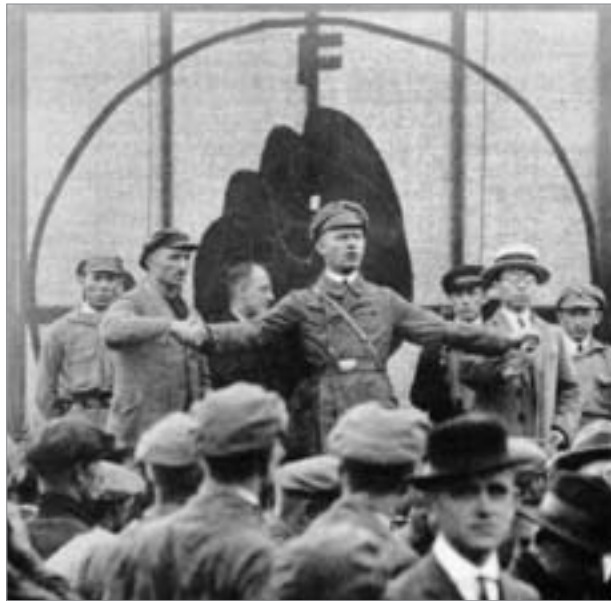
Ernst Thälmann mit einem sowjetischen Seemann und einem chinesischen Arbeiter auf dem Hamburger RFB-Gautreffen 1925

Eine Fülle von Fakten belegt eine erfolgreiche ökonomische Bilanz. Von nicht geringem Interesse sind die Ausführungen zur Ausgestaltung des politischen Systems, zur Entwicklung der Partei sowie zu den Grundsätzen der Außenpolitik des Landes. Hauptteil der Dokumentation ist die fast 200 Druckseiten umfassende und offiziell bestätigte „Kurze Geschichte der KP Chinas“, ein höchst interessanter Abriß, der