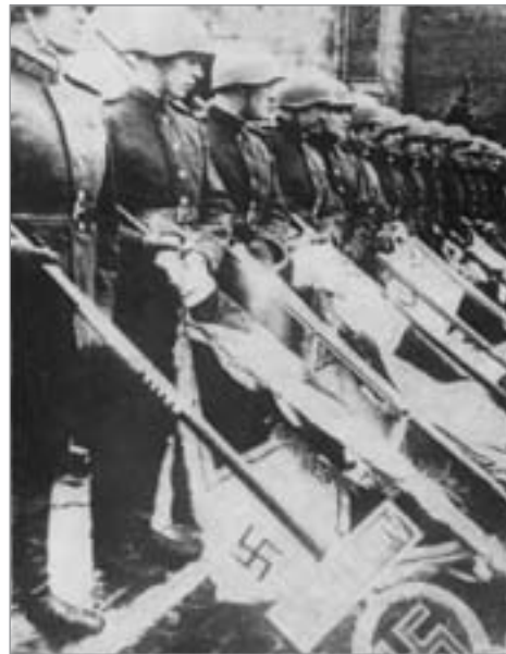
Moskau, Mai 1945

Selten trolleten wir uns im Treck auf asphaltierten Straßen. Das war zum Vorteil der Rinder, die immerhin 15 Kilometer am Tag