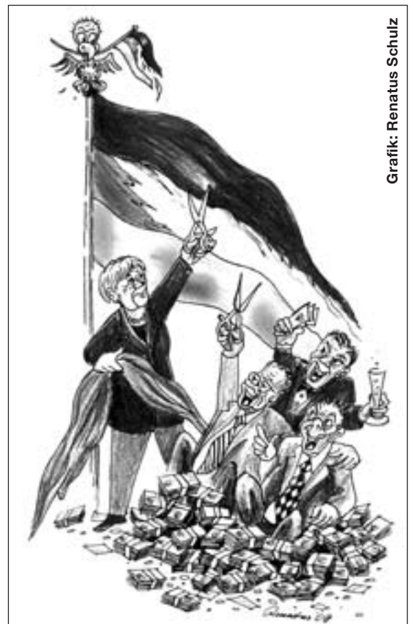
Grafik: Renatus Schulz