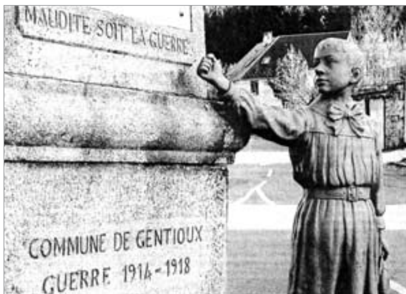
„Verflucht sei der Krieg!“ – Denkmal in der französischen Gemeinde Gentioux (Departement Creuse) für die vom Tod der Väter getroffenen Kinder