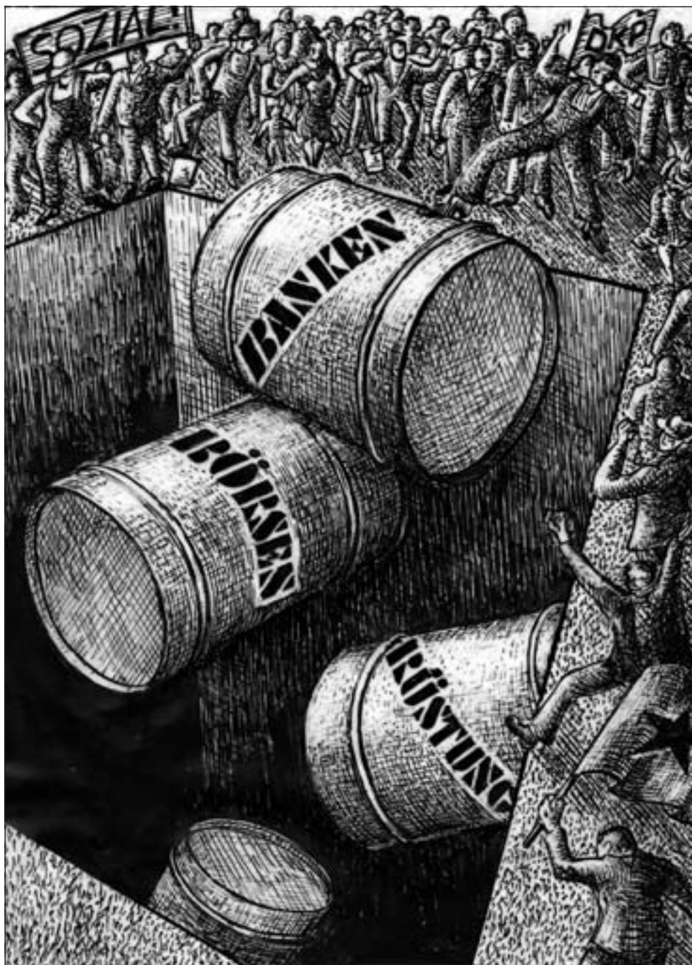
Sondermüll des 21. Jahrhunderts