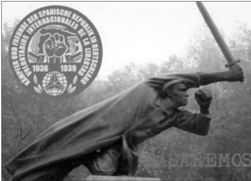
Skulptur von Fritz Cremer im Berliner Volkspark Friedrichshain

Leitung von „Pasionaria“, dem Organ der antifaschistischen Frauen Valencias, das damals die Hauptstadt der Republik war. Ihre Ratschläge wurden von Renau immer beachtet – sei es bei der Rettung des Nationalen Kunstschatzes aus dem durch die