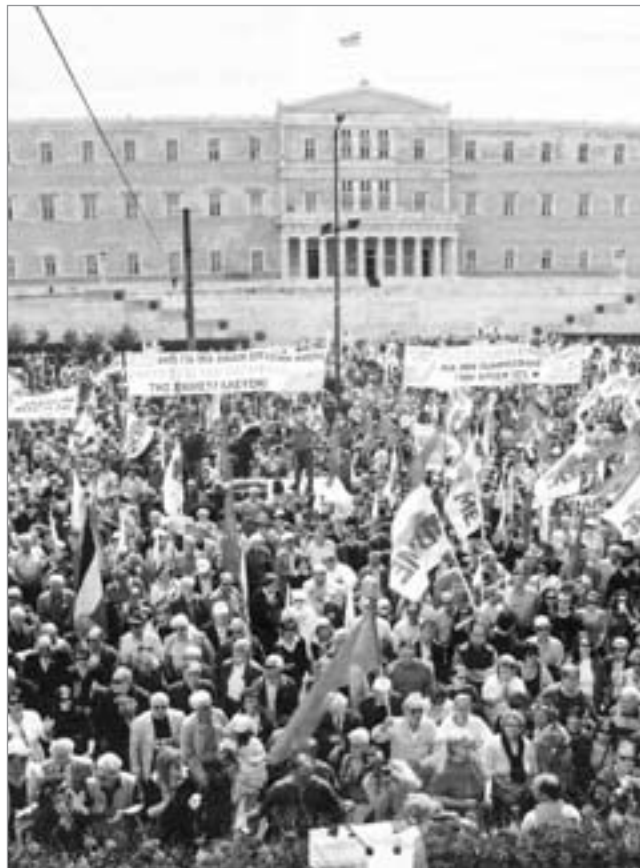
Ein Ausschnitt der Athener Streikkundgebung, zu der die linksgerichtete Gewerkschaftszentrale PAME am 17. Dezember 2009 aufgerufen hatte

einem großen Erfolg. Zahlreiche Arbeiter und Jugendliche stellten sich als Streikposten zur Verfügung, viele Tausende nahmen an den von der PAME in 63 Städten organisierten Protestversammlungen teil.