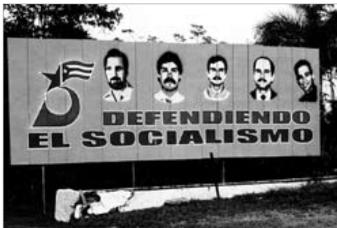
Losung an der Playa Giron: In Verteidigung des Sozialismus

weshalb es ja auch deren Annullierung anordnete. Es argumentierte damit, daß man den Verurteilten die Zurückhaltung