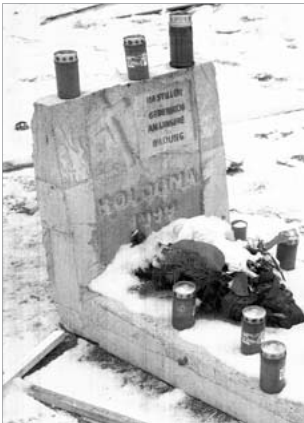
Dieses „Bildungsgrab“ haben die Besetzer der Münchener Ludwig-Maximilian-Universität errichtet. Die Aufnahme machte unser Leser und Autor Bernd Gutte aus Görlitz während des Bildungsstreiks der Studenten.

In der Schule wurden gute Voraussetzungen für ein späteres Hochschulstudium gelegt. Natürlich gab es auch eine gewisse Fluktuation, vor allem aus sozialen Gründen. Von über 20 nach 1945 in der Klasse angetretenen Schülern schafften nur 8 das Abitur. „Wenn unser Staat will, daß