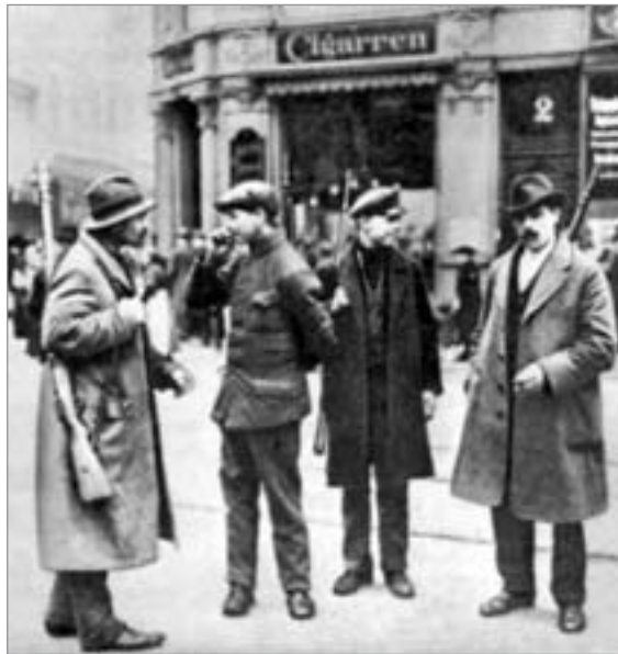
Kontrollposten der Roten Ruhrarmee, März 1920

Rote Ruhrarmee, der sich 100 000 Arbeiter angeschlossen haben. Und die eben durch die Einheitsfrontaktionen gerettete Regierung bedient sich dabei wiederum jener Einheiten, die wenige Tage zuvor angetreten waren, sie selbst aus dem Amt zu