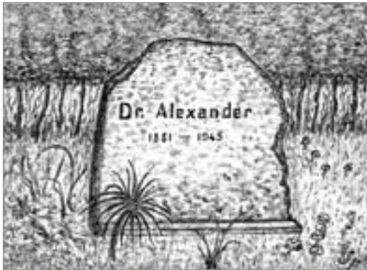
Grafik: Siegfried Spantig