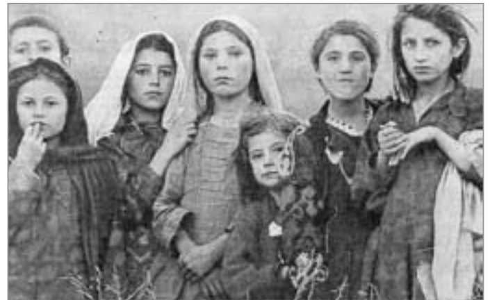
Afghanische Mädchen des Dorfes Ghumai verfolgen die Landung eines Hubschraubers der ISAF-Truppen.

Fördergemeinschaft Friedensarbeit e. V. Stichwort: „Afghanistan-Hilfe“ Sparkasse Marburg-Biedenkopf Konto-Nr.: 101 606 6997 BLZ: 533 500 00 (Die Spenden sind steuerlich absetzbar.)