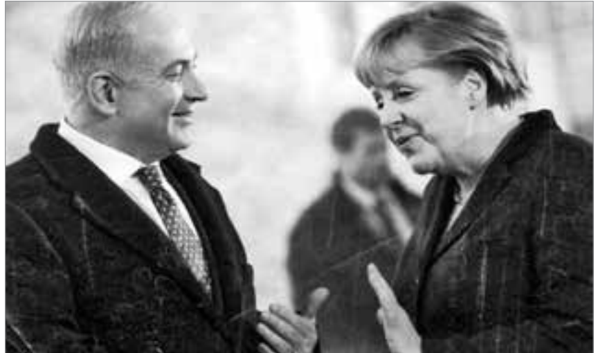
Israels zionistisch-rassistische Machthaber haben gute Freunde in Deutschland.

israelisch-palästinensischem Boden birgt eine große Tragik. Es ist zugleich aber auch eine Herausforderung, in der Solidarität mit den Verzweifelten und Entrechteten, welcher Nationalität, Rasse oder Hautfarbe auch immer,