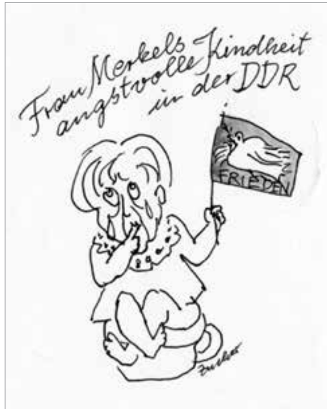
Grafik: Gertrud Zucker

ventionierter Haßprediger aller Ebenen, um ihre angebliche Höherwertigkeit zu erklären. Ich frage mich, was solche Leute wohl täten, wenn sie uneingeschränkte Handlungsfreiheit im Umgang mit jenen besäßen, welche sie so abgrundtief hassen. Mit Sicherheit würden sie in viel schlimmerer Form gerade das tun, was sie der DDR permanent unterstellen. Und ich sehe sie vor meinem geistigen Auge, wie sie sich gegenseitig auf die Schulter klopfen und bescheinigen, „immer sauber geblieben zu sein“.