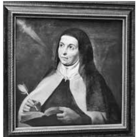
Peter Paul Rubens: Teresa von Ávila (1615)

Er möge sie bewahren „vor der großen Leidenschaft, die Angelegenheiten anderer