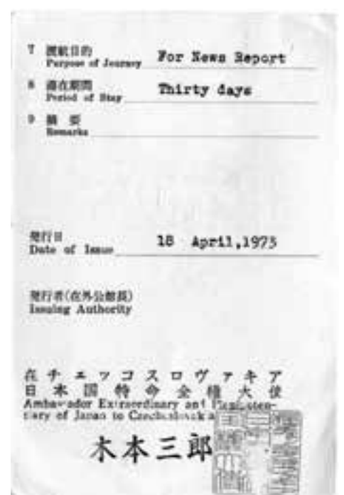
Reproduktion einiger Seiten des Travelboard-Ausweises