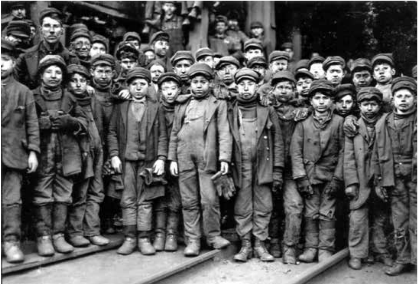
Minderjährige Kohlenbrecher der Ewen Breaker of Pennsylvania Coal Company in South Pittston, Januar 1911