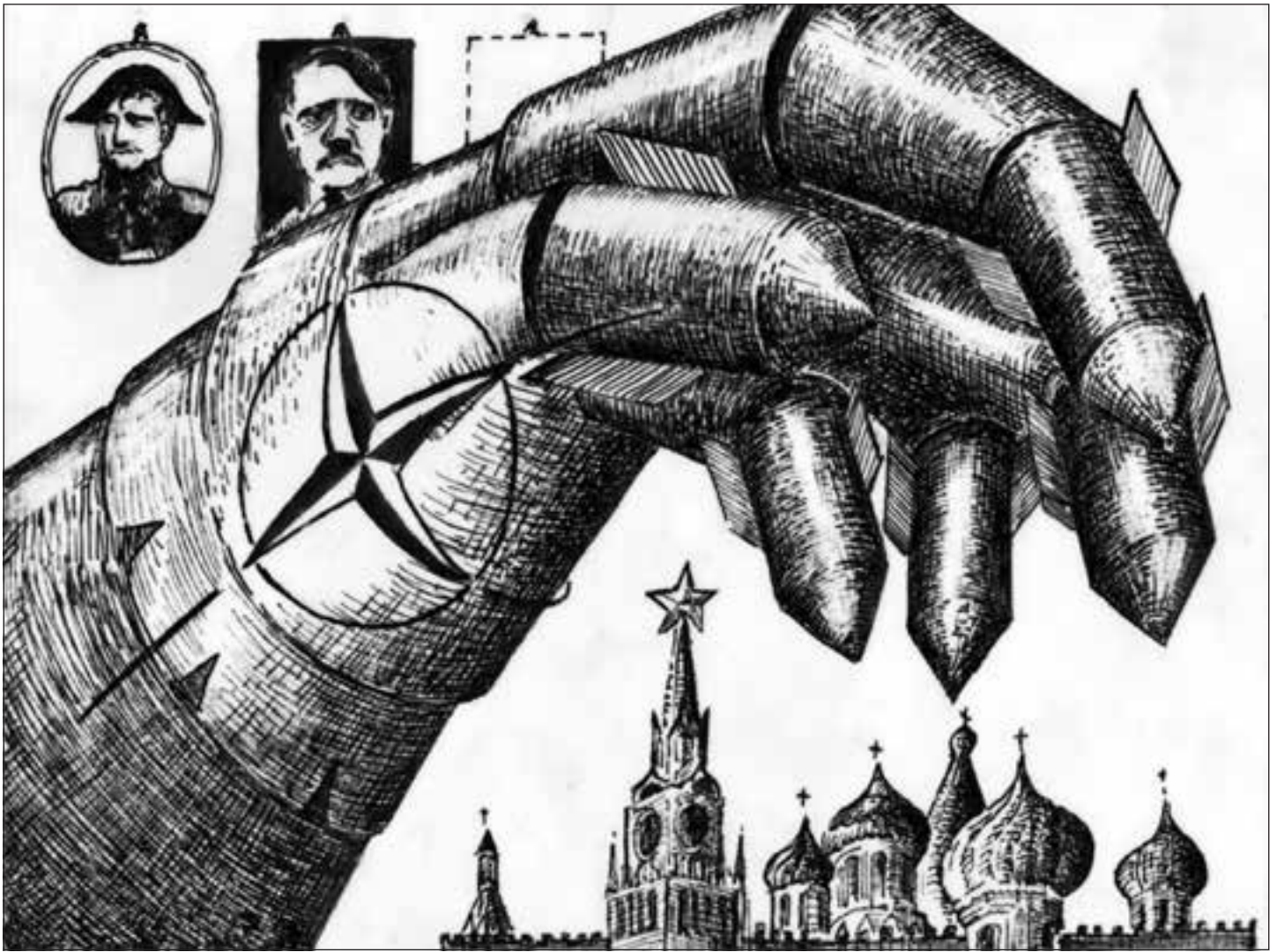
Die schnelle Eingreiftruppe auf den Spuren der Verlierer