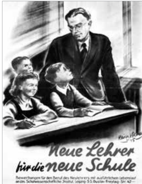
Plakat von Heinz Völkel aus dem Jahre 1945

kritisch – sicherlich auch weitgehend zu Recht – hinterfragt und beurteilt, aber leider meist nur mit der Tendenz, sie vollständig abzuschaffen, sowie mit der Zielsetzung, dafür überall nur Gesamtschulen mit gymnasialer Oberstufe anzubieten.