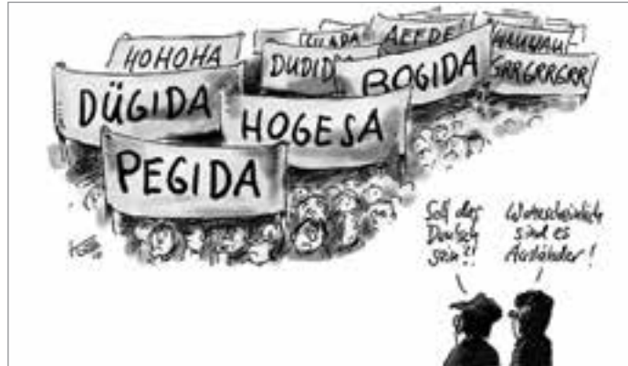
Karikatur: Klaus Stüttmann

Südafrikanern außerhalb des „Abendlandes“. Da in Dresden nach meiner Kenntnis nur Bürger der Bundesrepublik hinter dem PEGIDA-Transparent hergelaufen sind, kann man die „patriotischen Europäer“ wohl am exaktesten mit „Volksdeutsche“ übersetzen.