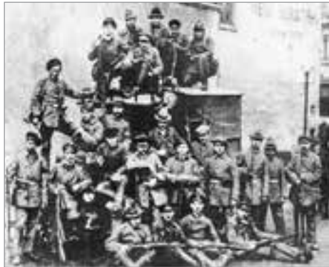
Solinger Rotarmisten bei einer Rast auf dem Weg nach Dinslaken/Wesel (Mitte März 1920)

Quellen erschlossen, die der Autor in jahrzehntelanger Recherche zusammengetragen hat. Zuerst geht das Buch aber auf die spon-