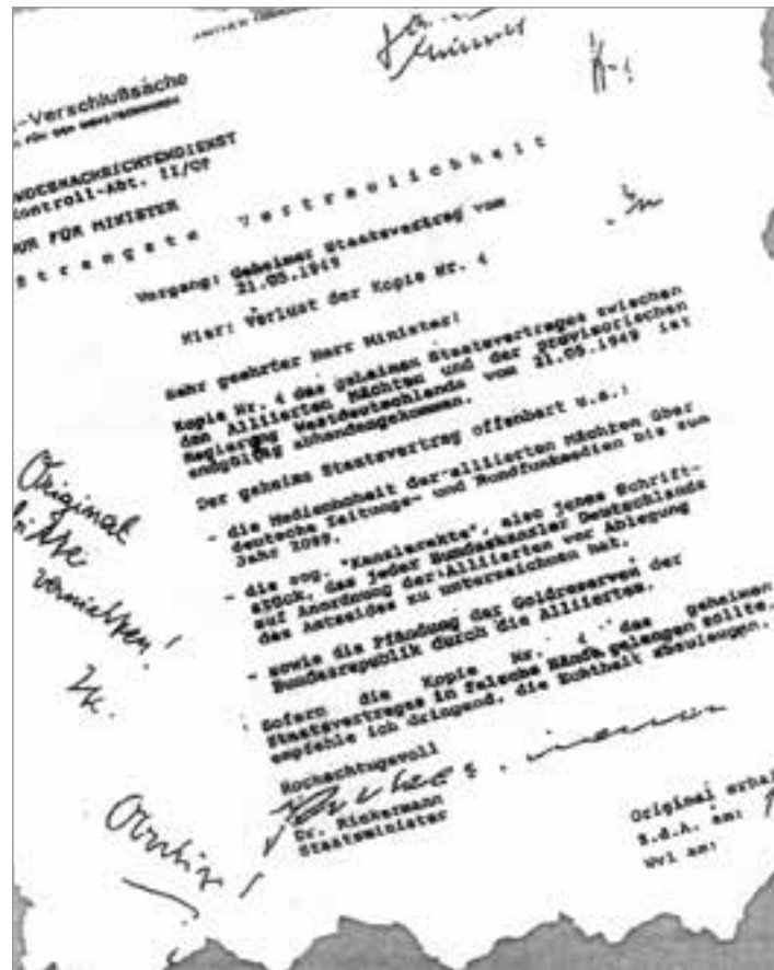
Vertrauliches Dokument des Bundesnachrichtendienstes

nität anderer Staaten mißachtet, selbst nicht souverän sein kann.