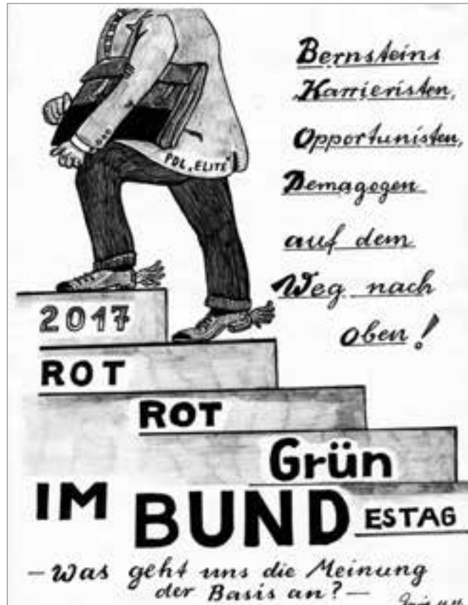
Zeichnung: Heinrich Ruynat

auf die Diffamierung der DDR als Unrechtsstaat – die Vorbedingung für jegliche Koalitionsvereinbarungen – ein solcher Wert gelegt wurde, müßte eigentlich jedem klarmachen, daß die Haltung zur DDR-Vergangenheit höchstes politisches Gewicht besitzt.