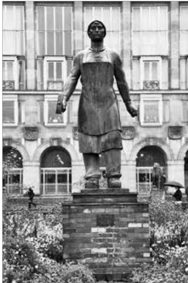
Trümmerfrauen-Denkmal vor dem Dresdner Rathaus