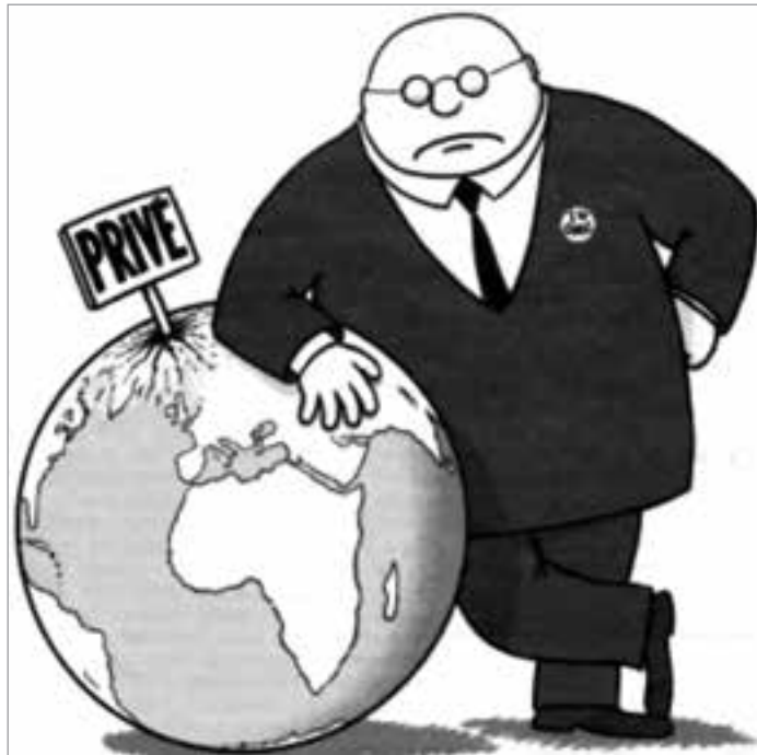
Karikatur aus „Intervention Communiste“, Frankreich

Jeder Kapitalist steht mit anderen Kapitalisten im Konkurrenzkampf, was ihn dazu zwingt, mehr Profit als seine Rivalen zu erzielen. Der Kampf um maximale Profite ist das ökonomische Grundgesetz der Kapitaleigner.