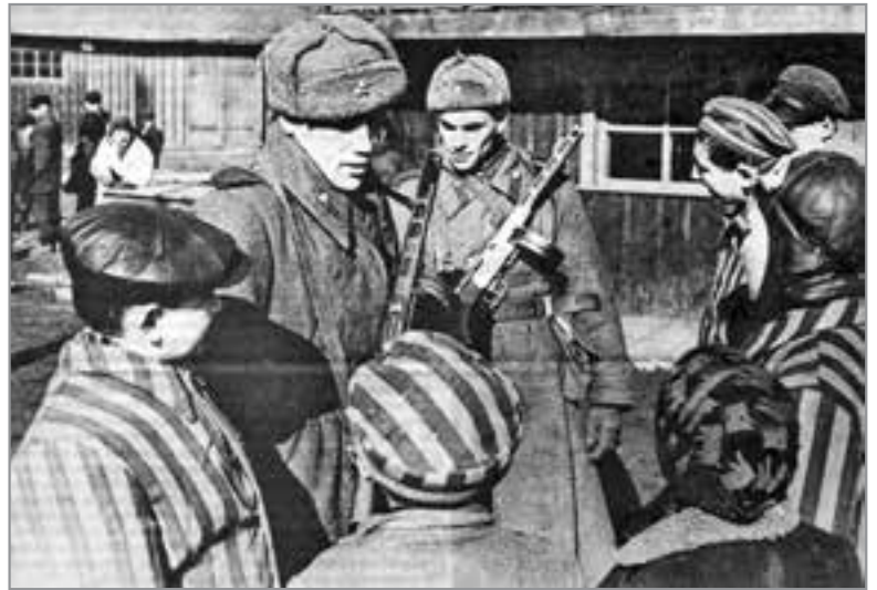
Die Lebensretter bei den jüngsten Häftlingen