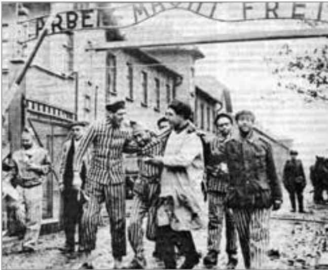
Ein sowjetischer Militärarzt leistet erste Hilfe.

Die Lebensretter waren Soldaten und Offiziere der 1. Ukrainischen Front und damit Angehörige aller Völker der UdSSR, nicht aber – wie fälschlicherweise ausgestreut wurde – „Ukrainer“. Die Fotos auf dieser Seite – sie stammen aus dem Archiv des DKP-Organs „unsere zeit“ – dokumentieren das dramatische Geschehen jenes Tages. RF