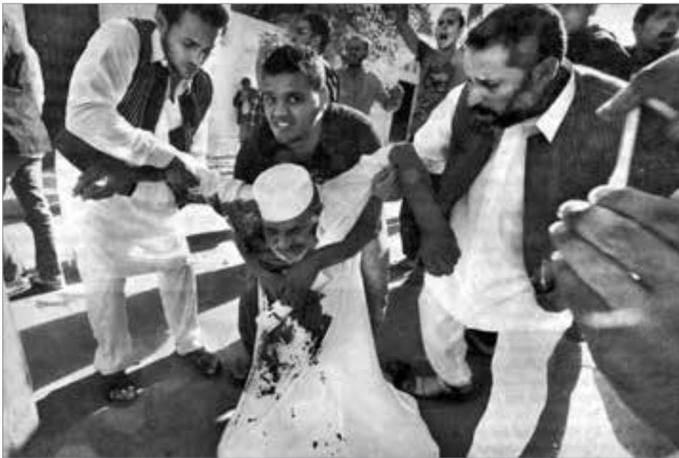
Demonstranten in Tripolis helfen einem von Terrormilizen verletzten Mitstreiter.

Im Jahr 1969 übernahm Oberst Gaddafi – ein antiimperialistischer Offizier – die Staatsgeschäfte in einem der ärmsten Länder Afrikas. Als er 2011 im Auftrag der USA ermordet wurde, war Libyen der wohlhabendste und sozial am meisten fortgeschrittene Staat des schwarzen Kontinents mit dem höchsten Pro-Kopf-Einkommen und der längsten Lebenserwartung. Dort vegetierten weniger Menschen unterhalb der Armutsschwelle als in den Niederlanden.