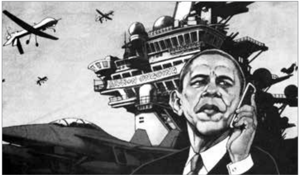
Karikatur aus „Economist“, London

tragischen Terroranschläge von Paris, die zu einem europäischen 11. September potenziert werden, gerade zur rechten Zeit kamen, um Gesetzesverschärfungen zu fordern und den Überwachungsstaat weiter auszubauen. Ein trauriger Anlaß, aber die kürzlich in Mexiko abgeschlachteten