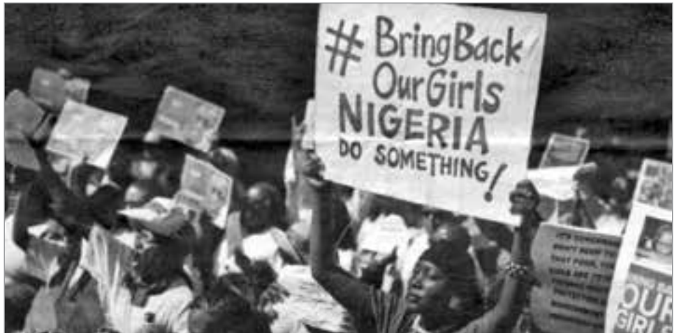
Mütter verschleppter Schülerinnen aus Chibok fordern von Nigeria Taten zur Rettung ihrer Töchter.

Nigerias Reichtum ist das Erdöl. Der OPEC-Mitgliedsstaat liegt derzeit an 13. Stelle unter den Förderern des schwarzen Goldes. Seine Ölreserven werden auf 37 Mrd. Barrel (Faß) geschätzt. Vermutet werden überdies erhebliche Mengen Erdgas. Die Exportstruktur des ostafrikanischen Landes basiert auf Erzeugnissen des Bergbaus, der Landwirtschaft und