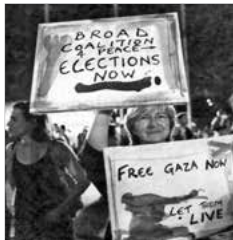
Solidarität mit Gaza auf dem Rabin-Platz in Tel Aviv

Der erste Kongreßtag hatte ganz im Zeichen des Protests gegen die Ermordung des palästinensischen Ministers Ziad Abu Ein durch das israelische Militär gestanden. Diese neue Gewalttat der zionistischen Machthaber wurde durch die Parteitagsteilnehmer auf das schärfste verurteilt. Die KPI wandte sich gegen die anhaltende Besetzung palästinensischer Territorien durch Israel und sprach sich für die Schaffung eines souveränen Staates Palästina im Sinne der UNO-Beschlüsse aus. Das höchste Gremium der Kommunisten Israels war nach der durch Tel Aviv verfügten