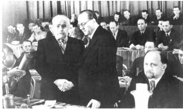
Wilhelm Pieck, Otto Grotewohl und Walter Ulbricht (v. l.) am 21. April 1946 in Berlin auf dem Gründungsparteitag der SED

Ende 1945 zeichnete sich in Deutschland eine bedeutende Zuspitzung des Klassenkampfes ab. Die Kräfte der Reaktion sammelten sich in Westdeutschland unter dem Schutz der imperialistischen Mächte, welche die Verwirklichung der auch von den Westmächten im Potsdamer Abkommen beschlossenen Maßnahmen zur Denazifizierung, Demilitarisierung und Demokratisierung in zunehmendem Maße sabotierten. Als Spitzenvertreter der deutschen Reaktion erklärte Konrad Adenauer