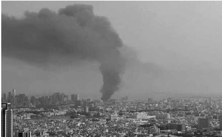
Bahrain, 28. Februar: Iranische Geschosse haben den Stützpunkt der 5. US-Flotte in Manama getroffen

mit Unterstützung der CIA und des Mossad – hat die Situation aber fest im Griff. Schon während des „arabischen Frühlings“ unterband er alle Aktivitäten der Moslebrüder. Und Israel selbst ist kein Hort der Stabilität. Netanjahus Regierung kann ihre Kriege unangefochten führen. Doch in der Knes-