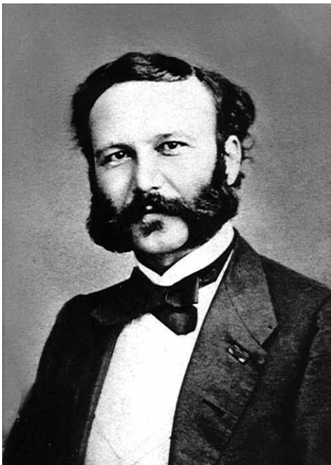
Henry Dunant (1828-1910), erster Friedensnobelpreisträger 1901

Truppenführer gekämpft und setzte nach dem Sieg seines Vorgängers über Spanien, die den USA die Kontrolle über Kuba, Puerto Rico, Guam und die Philippinen einbrachte, dessen Politik fort. Er erweiterte die Monroe-Doktrin um die Politik des Big Stick, was meinte, alle, die sich nicht den US-Forderungen unterwarfen, mit Gewalt bedrohen zu sollen. So wurden fortan die US-amerikanischen Marineinfanteristen, besser bekannt als Marines oder Lederhosen, zu bewaffneten Botschaftern US-amerikanischen Willens und tauchten fürderhin immer mal wieder vor oder an den Küsten fremder Länder auf, um US-Außenpolitik durchzusetzen. Der bisher letzte