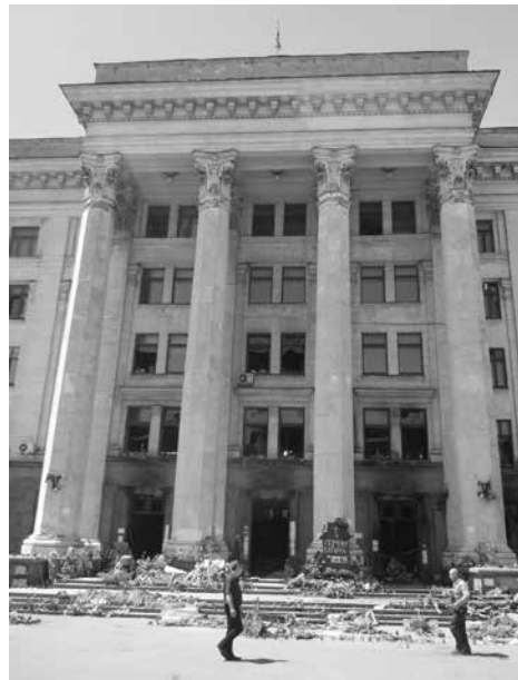
Das ausgebrannte Gewerkschaftshaus in Odessa nach der faschistischen Mordnacht vom 2. Mai 2014

Mit dem Einsatz von einigen weitreichenden Flamingo-Raketen „eigener Produktion“ (bevor der ukrainische Betrieb von der RF mit Hyperschall-Raketen zerstört worden war) durch die Ukraine auf wertvolle Ziele Rußlands (z. B. auf das Iskanderwerk), wodurch es teilweise zu Einschränkungen der Leistungsfähigkeit des MIK der RF kam, und dem Einsatz von immer mehr NATO-Spezialkräften auf ukrainischer Seite (Odessa,