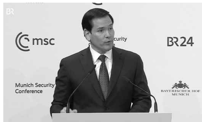
München, 13. Februar: US-Außenminister Marco Rubio will mit „gottlosen kommunistischen Revolutionen“ Schluß machen

Einerseits spricht der Bundeskanzler davon, mit Rußland wieder reden zu wollen und zu müssen und andererseits sichert er der Ukraine Unterstützung und weitere Waffenlieferungen zu. Dem Generalinspekteur