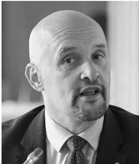
Der Lette Janis Sarts (geb. 1972) ist seit Juli 2015 Stratcom-Direktor in Riga

der „Bundesakademie für Sicherheitspolitik“ (BAKS) liest man: „Die Geschichte von NATO StratCom beginnt als Mängelfeststellung: In Afghanistan machten die NATO-Verbündeten die Erfahrung, daß fehlende Koordination von Kommunikationsarbeit, unterschiedliche Zielgruppendefinitionen und Unstimmigkeiten zwischen Kommunikationsdisziplinen den Erfolg des gesamten Einsatzes gefährdeten“. Ergo sollte eine supranationale Koordinationsstelle ins Leben gerufen werden, die künftig sowohl feindliche Desinformationsoperationen kontern sollte und zugleich „die eigene Bevölkerung“ mit zweckdienlichen Narrativen versorgen und steuern sollte. „Um die konzeptionellen und operativen Grundlagen strategischer Kommunikation im NATO-Rahmen zu schaffen, gründeten 2014