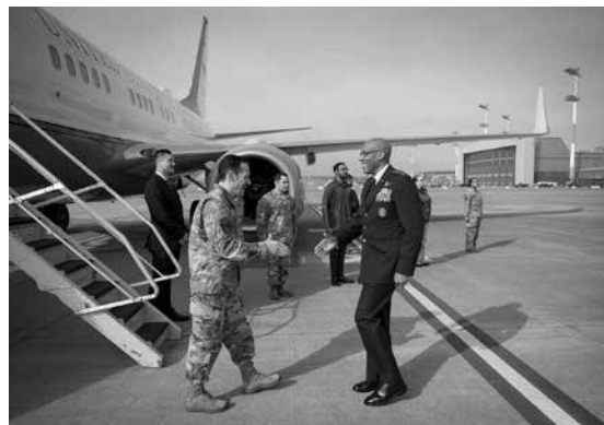
Am 19. März 2024 traf sich die „Ukraine-Kontaktgruppe“ auf der US-Airbase Ramstein

deutschen Grundgesetzes, sind de facto Enklaven. Dabei hatte das Bundesverfassungsgericht im Urteil des Zweiten Senats vom 15. Juli 2025 (2 BvR 508/21) zum Drohneneinsatz über Ramstein in seinen Leitsätzen ausdrücklich festgehalten: Der Bundesrepublik Deutschland „obliegt ein allgemeiner Schutzauftrag dahingehend,