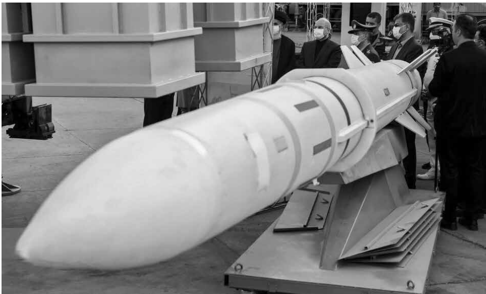
Der Iran verfügt über weitreichende Raketen, hier eine Sayyad-3

Die USA und Israel versuchen seit einigen Monaten, einen Teil der libanesischen Führung dazu zu bewegen, die Aufgabe der Entwaffnung der Hisbollah zu übernehmen, wie Rubio erklärte, „damit Israel dies nicht tun muß“ – etwas, das die libanesischen Führer offensichtlich nicht tun können.