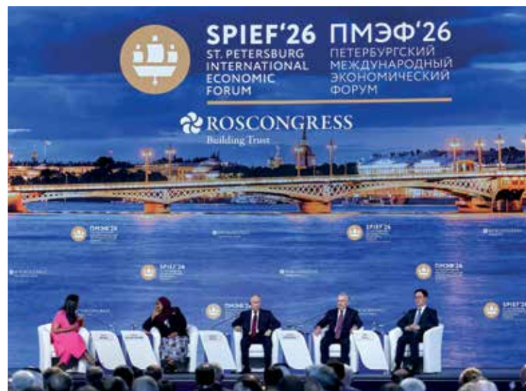
Rußland „isoliert“: Plenarsitzung auf dem Internationalen Wirtschaftsforum St. Petersburg am 5. Juni mit (v. l.) der indischen Moderatorin Geeta Mohan, Tansanias Präsidentin Samia Suluhu Hassan, dem russischen Präsidenten Wladimir Putin, dem Präsidenten Usbekistans Shavkat Mirziyoyev und dem Vizepräsidenten Chinas Han Zheng

Flankiert wurden und werden seither die obigen Entwicklungen mit einer propagandistisch als antistalinistisch gefärbten Unterstellung, daß Putin eine Wiedererrichtung der Sowjetunion betreibe. Dies werde u. a. auch zur Rückkehr harter Bekämpfungsmaßnahmen gegen die Opposition führen, was sich bereits in der heutigen russischen Strafgesetzgebung gegen oppositionelle Kritik von innen und außen dokumentieren würde. Die etwa seit zwanzig Jahren anschwellende allgemeine Russophobie in der Propaganda der EU-Staaten erfährt in der Dämonisierung der Person des russischen Präsidenten ihren bisherigen Höhepunkt. Sie bleibt auf Grund des im Westen üblichen Verständnisses von Politik vorrangig durch Personifizierung, bei zugleich weitgehender Ignorierung ihrer Rolle als Exponenten