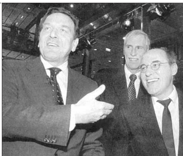
Auch der Kanzler kann mit Gysi (ND, 1. August 2002)

Die Selbstkritik hat viel für sich. Gesetzt den Fall, ich tadle mich; So hab ich erstens den Gewinn, daß ich so hübsch bescheiden bin; zum zweiten denken sich die Leut', der Mann ist lauter Redlichkeit; auch schnapp ich drittens diesen Bissen