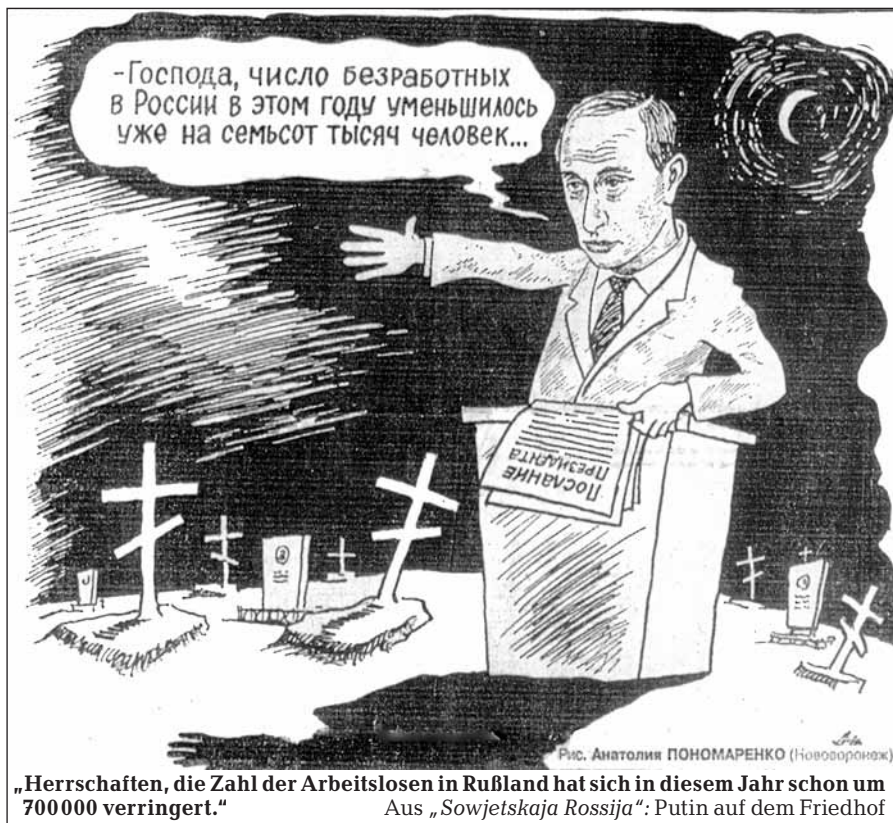
„Herrschaften, die Zahl der Arbeitslosen in Rußland hat sich in diesem Jahr schon um 700 000 verringert.“ Aus „Sowjetskaja Rossija“: Putin auf dem Friedhof

In Moskau wird eine neue Publikation unter dem traditionsreichen Namen „Iskra“ herausgegeben. Es handelt sich um das Analytische Informations-Bulletin der Volks-Patriotischen Union Rußlands (VPUR). In der VPUR – einer breiten Front unterschiedlicher Kräfte – sind die Patrioten vereinigt, die sich für die Überwindung der derzeitigen Misere und die Wiedergeburt Rußlands als mächtiger sozialistischer Staat einsetzen. R. F.