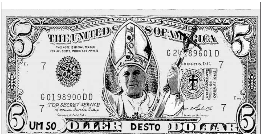
Die Offenbarung de" Johanne" PAUL II.