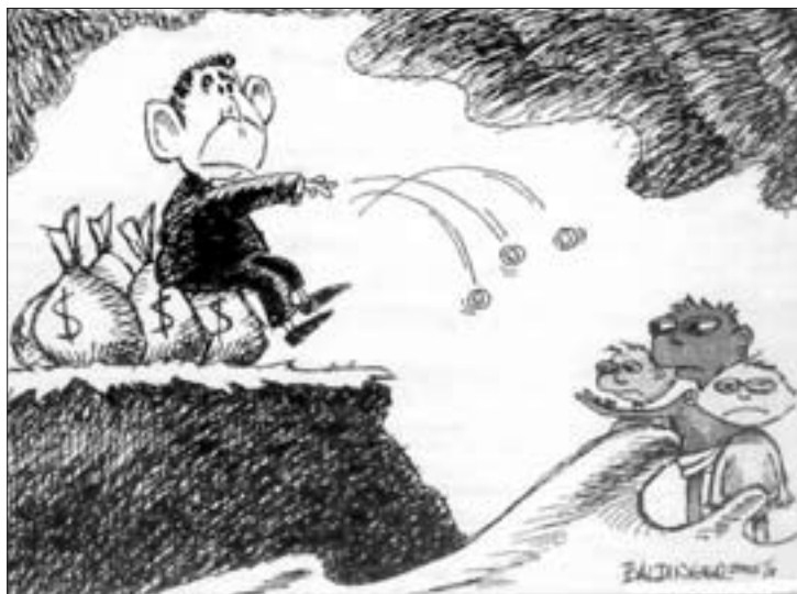
Hilfe für die dritte Welt

Dieser Beitrag von Thomas Schulz wurde dem „Spiegel“ 13/2005 gekürzt entnommen.