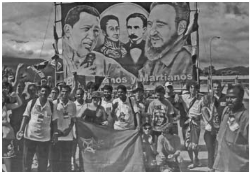
Übrigens: Die Weltfestspiele fanden in Caracas und nicht in Köln statt

Ob das Abschneiden bei den Tests dann direkt im nächsten Etat der Schule berücksichtigt wird oder die als „schlecht“ Getesteten über das Elternwahlrecht verdrängt werden – in jedem Fall bestimmt der Test den Unterricht. Und diesen wiederum bestimmen große Bildungskonzerne wie Bertelsmann. Platz für Inhalte, die Interessen der Bevölkerung betreffen, bleibt da nicht. Auf diese Weise findet Reich zu Reich, während die Armen unter sich bleiben. Fritz Dittmar, Hamburg