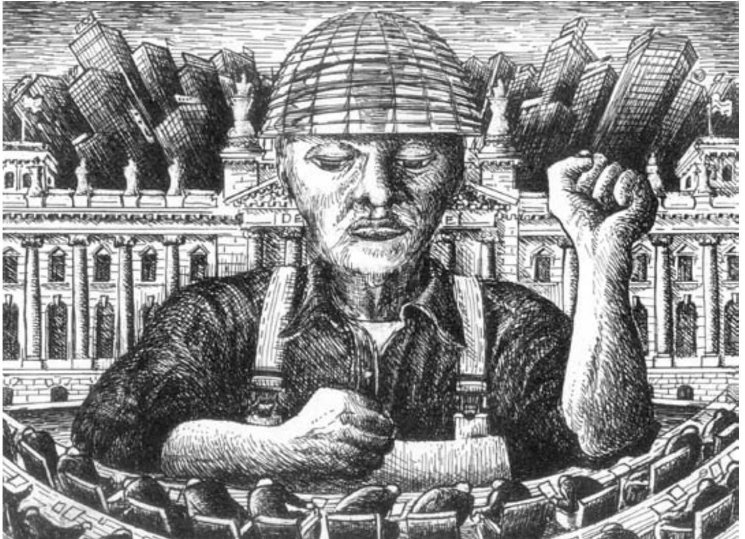
Die Stimme, die sie fürchten!