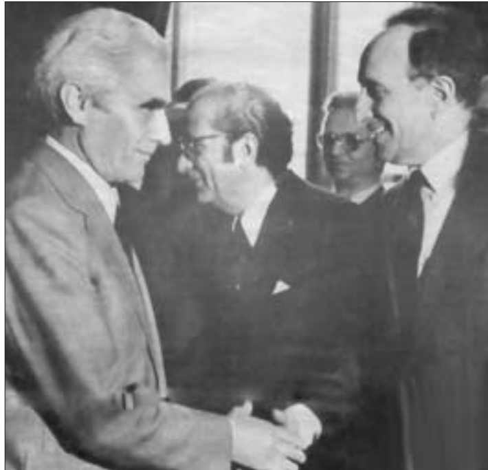
Minister Álvaro Cunhal, Staatspräsident Francisco da Costa Gomes, Ministerpräsident Vasco Gonçalves (v. l. n. r.)