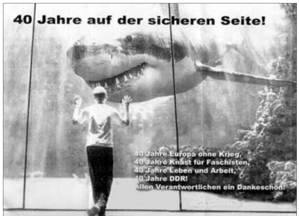
Postkarte der FDJ Berlin