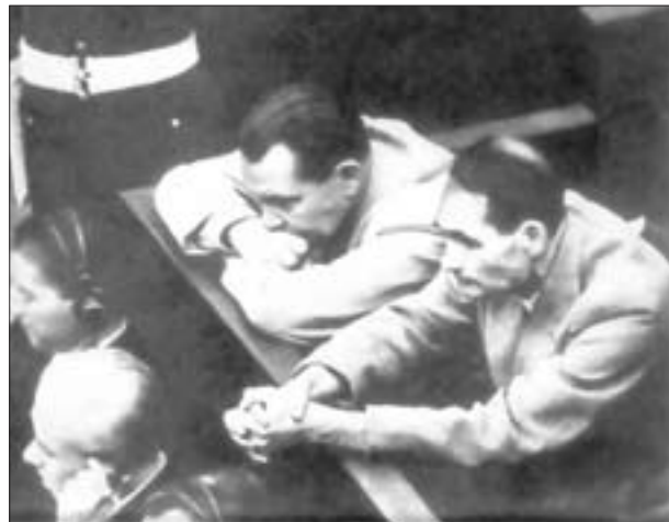
Göring und Heß bei der Eröffnungsverhandlung des Tribunals

Faschismus angegriffen und okkupiert wurden. Der Internationale Gerichtshof sah sich in diesem Prozeß nicht als zuständig an, die Verbrechen der faschistischen Herrschaft gegen die eigene Bevölkerung zu ahnden. Man ging jedoch davon aus, daß mit dem Verfahren Rechtsmaßstäbe gesetzt würden, auf deren Grundlage später deutsche Gerichte die Verbrechen gegen Deutsche selbständig verfolgen könnten.