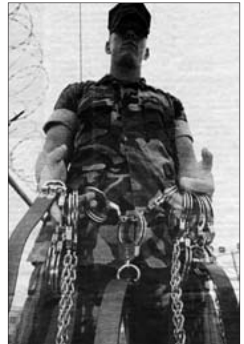
Handwerkszeug in Guantánamo