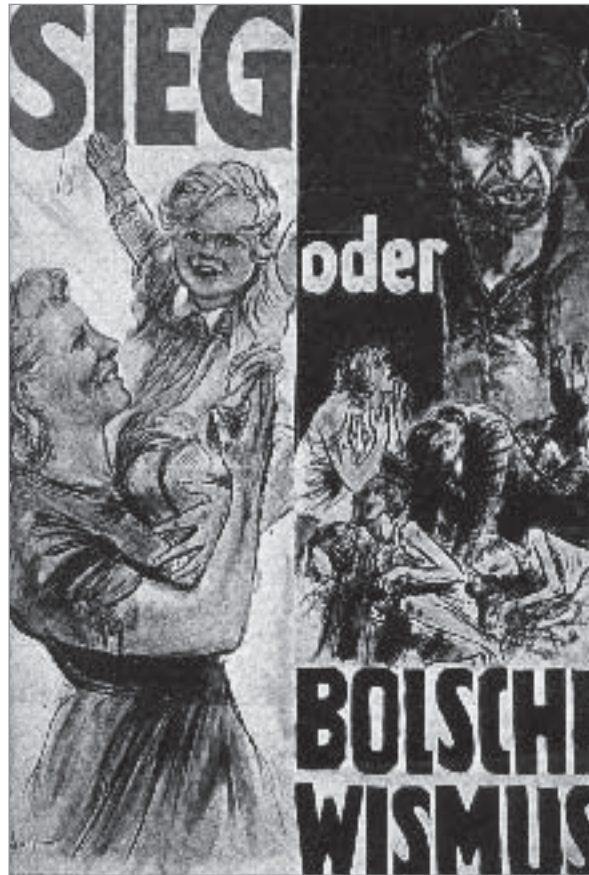
Goebbels-Plakat aus dem Jahr 1943

Militärisch war die UdSSR im August 1939 mit der Abwehr eines japanischen Angriffs auf die Mongolei bei Chalchin Gol gebunden. Moskau war isoliert und sah sich der Gefahr gegenüber, in den Krieg einbezogen zu werden. Als „Alternative“ drohte