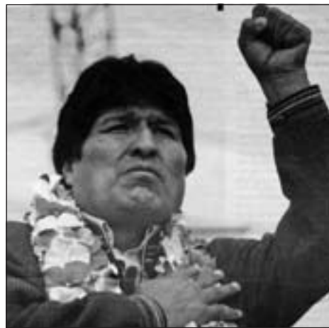
Bolivians Präsident Evo Morales

der Weltbank und der Weltgesundheitsorganisation zur Bedingung habe. Die Teilnehmer des ALBA-Gipfels forderten die Vereinigten Staaten auf, „der langen und verhängnisvollen Tradition des Interventionismus und der Aggression, welche sich in der Amtszeit der Administration George W. Bushs enorm verschärft habe, ein Ende zu setzen. Einmischungspraktiken wie verdeckte Operationen, Paralleldiplomatie