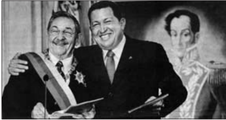
Kubas Präsident Raúl Castro bei Venezuelas Staatschef Hugo Chávez

zu verdreifachen, um einer neuen Weltwirtschaftsordnung den Weg freizumachen, welche die Umwandlung des IWF,