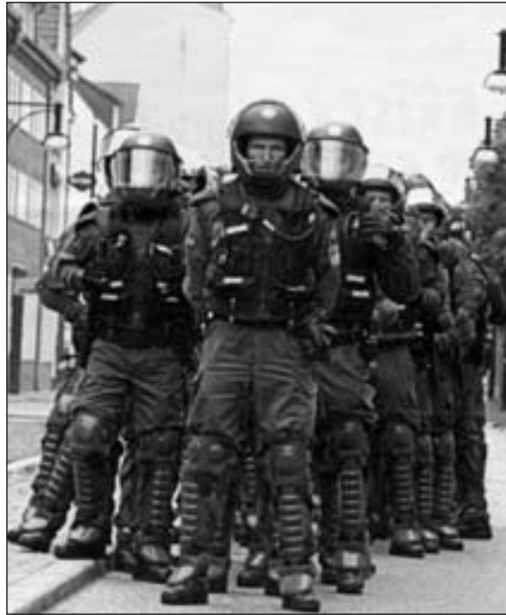
Der NATO-Gipfel wird geschützt

auf gerichtet ist, seine Ziele gegen bestehende Ordnungen durchzusetzen. Das alles wird an Beispielen auch im Artikel