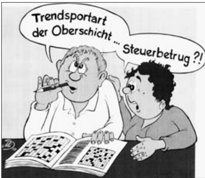
Zeichnung: Michael Westphal

Mit frommem Augenaufschlag wird eine „Korrektur nach unten“ vorgenommen, als ob das ganz selbstverständlich sei. Zunächst verschleudert man Milliarden an die Banken, dann wird medienwirksam auf die quietschende „Schuldenbremse“ getreten. Für den potentiellen Wähler, den man auf seine Seite ziehen will, seufzt man mal über Bonuszahlungen, mal über Managergehälter. Das Schnüren (wie aktiv!) immer neuer „Konjunkturpakete“ wird inszeniert wie im Zoo, wo man von Gehege zu Gehege geht, und mal Opel, mal Daimler, mal der einen, mal der anderen Bank etwas Futter hinwirft. Die „Politiker“, die auch keinen „Durchblick“ haben, erweisen sich als hilflos-verlogen stammelnde, skrupel- und gewissenlose Gefangene der herrschenden Produktionsverhältnisse, nur auf höherem Niveau. Zur Abwechslung bringt „man“ sogar Marx oder „Verstaatlichungen“ ins Gespräch. Die Angebotspalette der Roßtäuscher ist mannigfaltig.