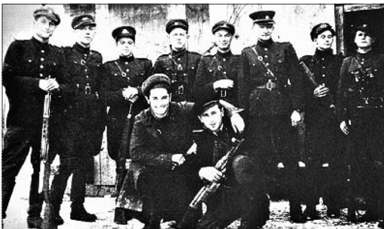
Die „Waldbrüder“ von Kureme

100 000 Litauern, die zu unterschiedlichen Zeiten bis 1952 bei den „Waldbrüdern“ kämpften. Diese Zahlen sind zu hoch angesetzt. Selbst für die ständige Truppe angegebene 30 000 bis 50 000 Mann scheinen übertrieben zu sein. Es handelte sich meistens um Leute, die den Absprung