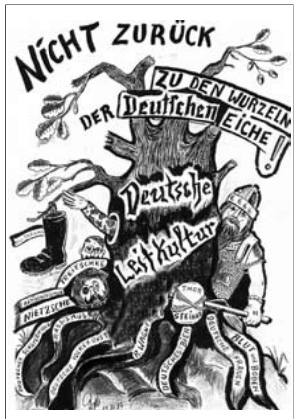
Zeichnung: Heinrich Ruynat