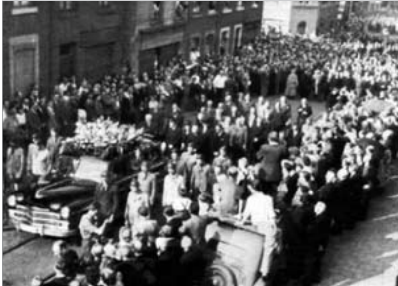
300 000 Menschen folgten dem Sarg des ermordeten Kommunisten.

Die bürgerliche Presse nahm ihn wütend unter Beschuß, er wurde verhaftet und sowohl aus der zum Reformismus tendie-