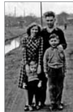
Am 17. November begeht das Hamburger kommunistische Urgestein