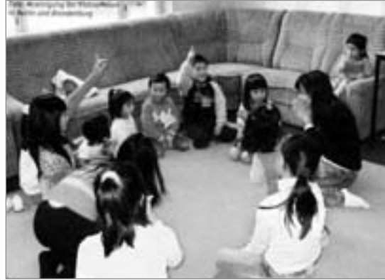
Vietnamesischen Kindern in Berlin wird ihre Muttersprache vermittelt.

Nguyen: Wer legal hier lebt, ist auch gut integriert. Im Unterschied zu anderen Migrantengruppen fallen die Vietnamesen nicht auf, sie leben ruhig. Viele sind als Blumen-