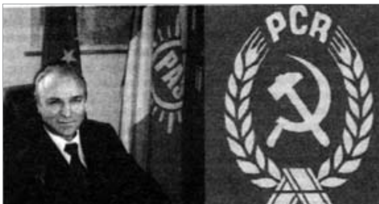
Der Vorsitzende der Rumänischen Kommunistischen Partei (PCR) Constantin Rotaru

Die verbliebene Mehrheit der PSM gründete dann die Sozialistische Allianzpartei (PAS), die sich in den darauf folgenden Jahren ununterbrochener Destabilisierungsversuche seitens der Sozialdemokraten einer- und pseudorevolutionärer Splittergruppen andererseits erwehren mußte. Darunter litt nicht nur die ideologische Wirksamkeit des Handelns der Partei, sondern auch deren Schlagkraft im Kampf gegen die Restauration des Kapitalismus und den rasanten Sozialabbau in Rumänien.