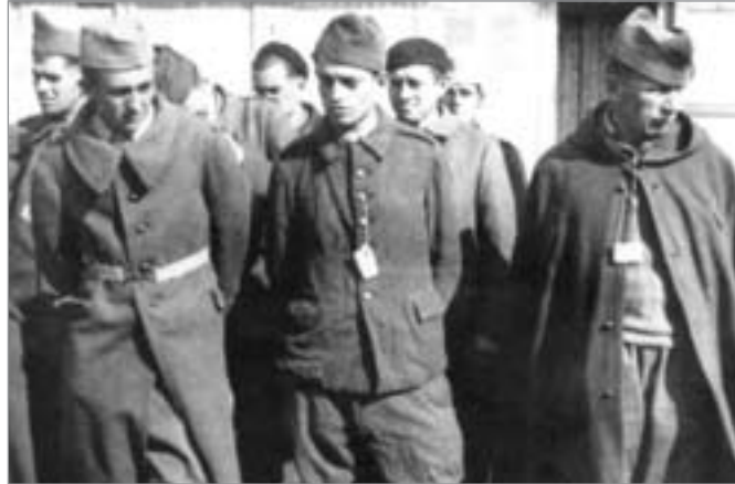
Französische Soldaten im faschistischen Kriegsgefangenenlager Lohberg (1940)

Es war dem Italiener, den seine thüringischen Freunde einfach Alexander nann-