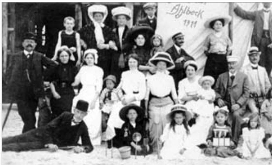
Nicht nur zu Kaisers Zeiten (unser Foto) spreizten sich reiche Nichtsteuer auf Usedom, das in den Jahren der DDR von den Werktätigen in Besitz genommen wurde.

gelernter DDR-Bürger anderswo, übrigens auch an der bulgarischen Schwarzmeerküste, jetzt heimischer fühlt. Dort hat er vorwiegend Albena im Sinn, denn am Goldstrand bei Warna gibt es bereits das übliche Ballermann-Ramba-Zamba-Getöse.