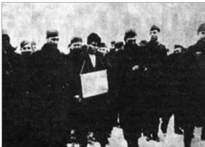
Die sowjetische Komsomolzin Soja Kosmodemjanskaja wird von deutschen Faschisten zum Galgen geführt.