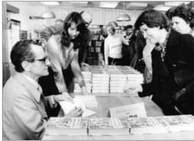
Dieter Noll beim Signieren seines Romans „Kippenberg“

ausgestrahlt. Oft verglich man den „Holt“-Film mit Bernhard Wickis Streifen „Die Brücke“, in dem das Endkampf-Elend „verheizter“ Kinder vorgestellt wurde. Regisseur Joachim Kunert zeigte anschaulich und eindrucksvoll, wie junge Menschen massenhaft manipuliert und verführt wurden. Der Roman lag Anfang 1990 im Aufbau-Verlag bereits in 41. Auflage vor