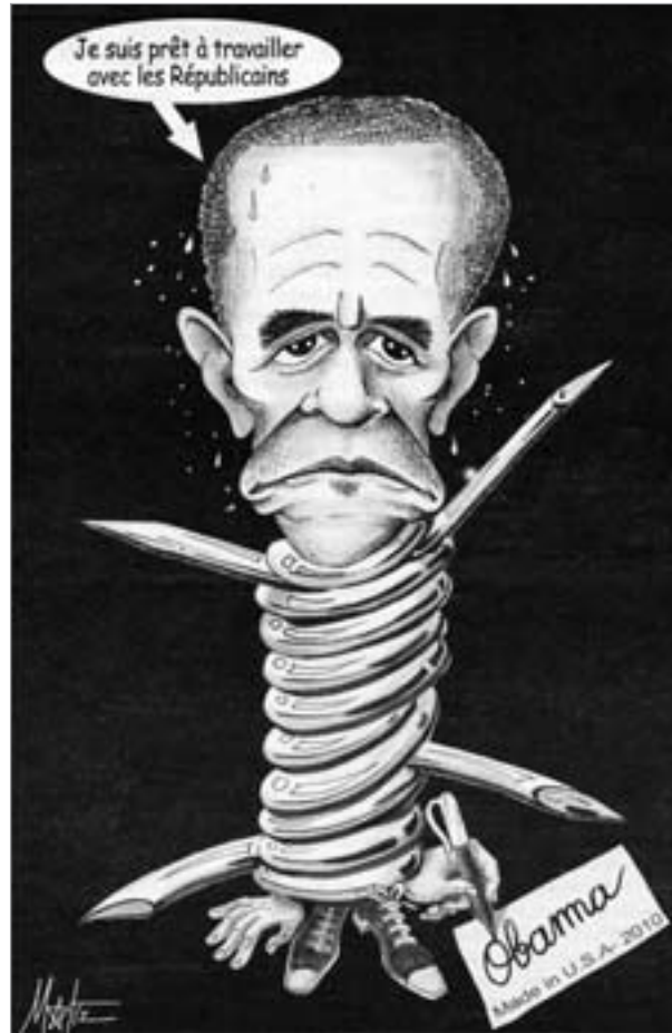
„Ich bin bereit, mit den Republikanern zusammenzuarbeiten.“ Karikatur aus „Solidaire“, Brüssel

die mächtigste Volksbewegung der jüngeren amerikanischen Geschichte buchstäblich von der Bildfläche. Sie machte nicht für Obama – einen in mancher Hinsicht durchaus positiveren Präsidenten als dessen Vorgänger seit 1945 – mobil, sondern gab statt dessen die Parole aus, der Frischgewählte solle zunächst einmal „Gelegenheit zur Arbeit“ erhalten.