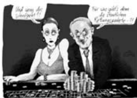
Karikatur: Klaus Stüttmann

te überwiegend in den Händen von Managern, qualifizierten Angestellten der großen Kapitalisten. Diese in der Regel hochdotierten Leute werden allerdings häufig selbst Besitzer von Aktienpaketen und sind durch Lebensführung wie soziale Vernetzung fest an ihre Auftraggeber gebunden.