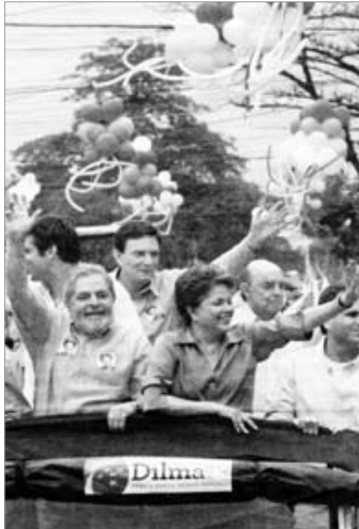
Dilma und Lula nehmen ein Bad in der Menge.

Lula, dessen Kurs seit 2002 am Ende seiner zweiten Wahlperiode 84% der Landesbürger zustimmten – ein einmaliger Vertrauensbeweis in Brasiliens Geschichte! –, konnte selbst kein drittes Mal für die Staatsspitze antreten, nachdem er 2006 bereits einmal wiedergewählt worden war.