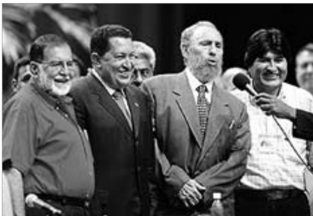
Schulter an Schulter im Kampf: Schafik Hándal (links), Hugo Chávez (Venezuela), Fidel Castro und Evo Morales (Bolivien)