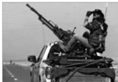
Ein libyscher „Rebell“ im Dienste der NATO

Doch weit gefehlt. Die Festlegung der Resolution Nr. 1973 des UN-Sicherheitsrates schließt lediglich den Einsatz von Bodentruppen der Aggressoren aus. Alles andere kann mit Mann und Maus be- und erschossen, zerbombt oder auch vergiftet werden, solange sich das aus der Luft machen läßt.