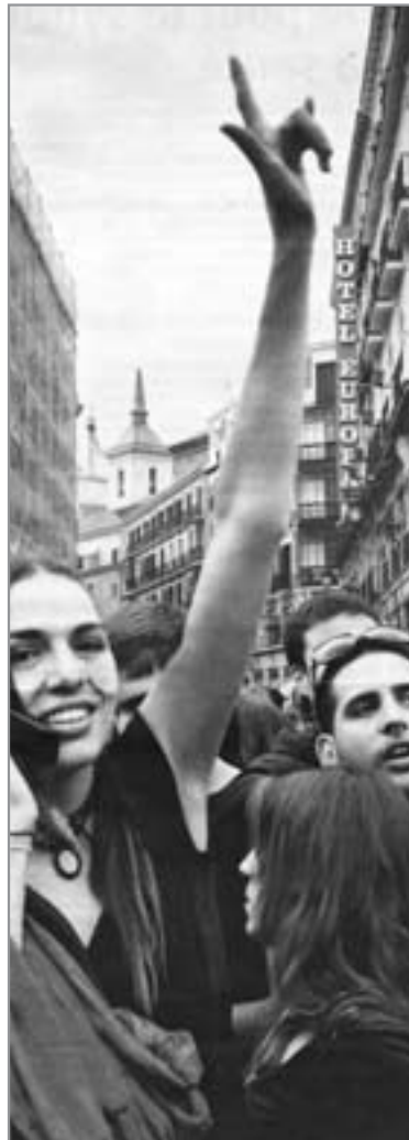
In Spanien hören die Proteste des von der EU ausgeplünderten Volkes nicht auf.

Angesichts des verheerenden Wahldebakels der PSOE hat die triumphalistische