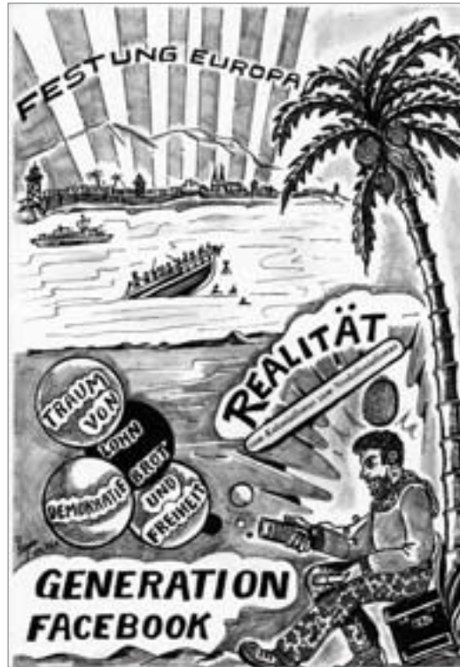
Zeichnung: Heinrich Ruynat

Dies alles unterstreicht die zwingende Notwendigkeit, auch mit linker sozialistischer Politik gegen den offenen oder verdeckten