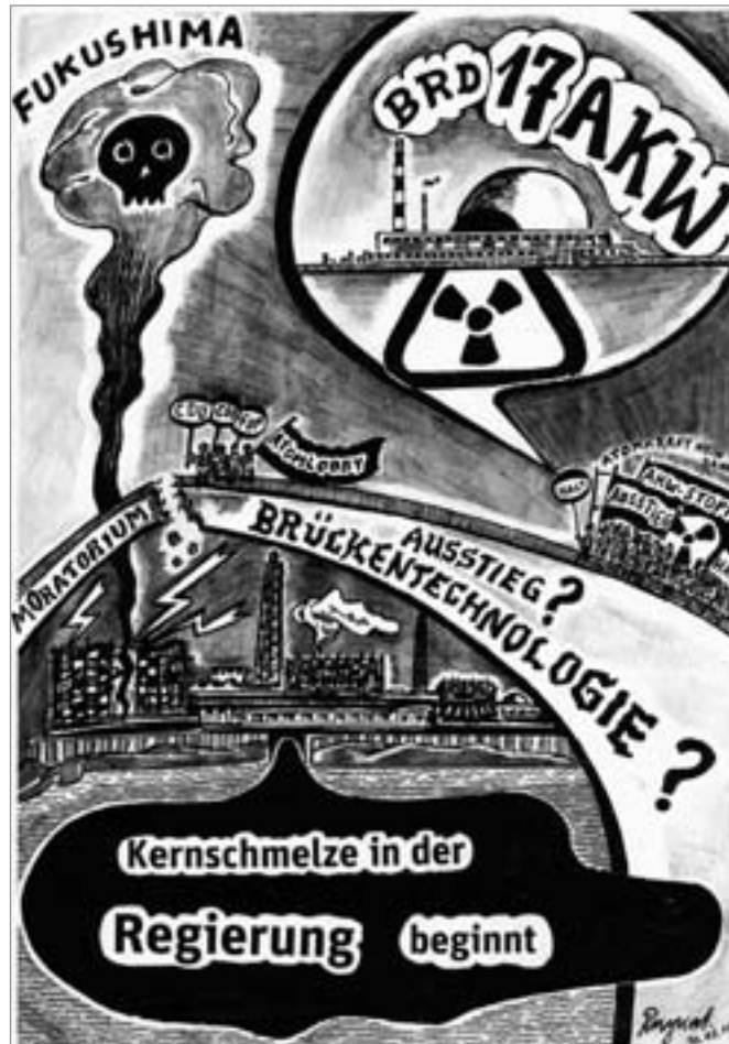
Zeichnung: Heinrich Ruynat

Gesellschaft?“ Es gehe um „sozial-ökologischen Umbau“. Dort finden sich einige präzisierungsbedürftige Ansätze zu einer alternativen Öko-Politik mit sozialistischen Untertönen. Erkennt man aber den kapitalistischen Konkurrenzkampf und den daraus resultierenden Wachstumszwang, der wiederum ein Ansteigen der Konsumgüterproduktion ohne jedes vernünftige Maß zur Folge hat, als Ursachen des immer höheren Energieverbrauchs, so wird das Verlangen nach einer Vergesellschaftung der Stromriesen – und keineswegs nur der auf Atomkraft setzenden – zur elementaren Voraussetzung jeglicher nachhaltigen Wende überhaupt.