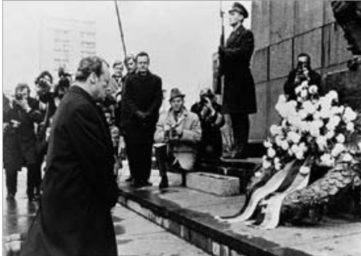
Der BRD-Kanzler und Führer der Sozialistischen Internationale in Demutpose am Warschauer Ghettondenkmal

Mitbestimmung, Fortschritte auf dem Gebiet der Tarifpolitik, der Gleichberechtigung von Frauen, der Gleichstellung Homosexueller sowie eine Neuorientierung auf den Gebieten der Jugendstrafrechts und der Schulpolitik verbuchen. Das hieß im Vokabular von Willy Brandt: „Mehr Demokratie wagen!“ Noch aus der