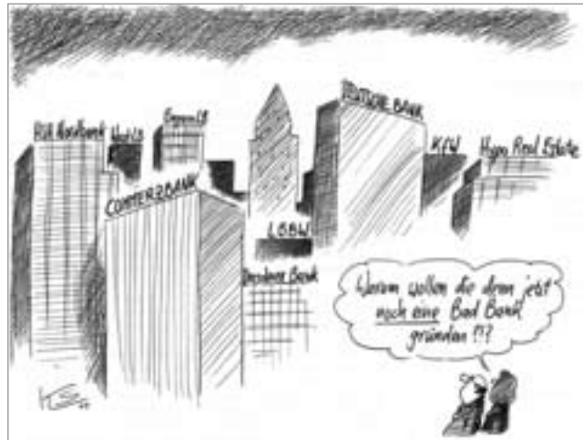
Karikatur: Klaus Stuttmann

unterhielt sie eine Reihe von Niederlassungen – so in Chicago, Amsterdam, Tokio und London.