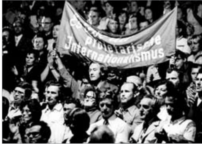
Die DDR fühlte sich stets den Antiimperialisten in aller Welt verbunden. Unser Bild zeigt eine Kundgebung am 14. September 1974 im Berliner Friedrichstadtpalast aus Anlaß des 1. Jahrestages des faschistischen Pinochet-Putsches in Chile.

als Antifaschist zu erkennen gegeben. Er übernahm später die Funktion eines Mitglieds des Lagervorstandes, hielt Referate und hat besonders seine Fähigkeit im Entwurf guter Plakate in den Dienst der Sache gestellt. Durch seinen Unglücksfall im November 1946 mußten