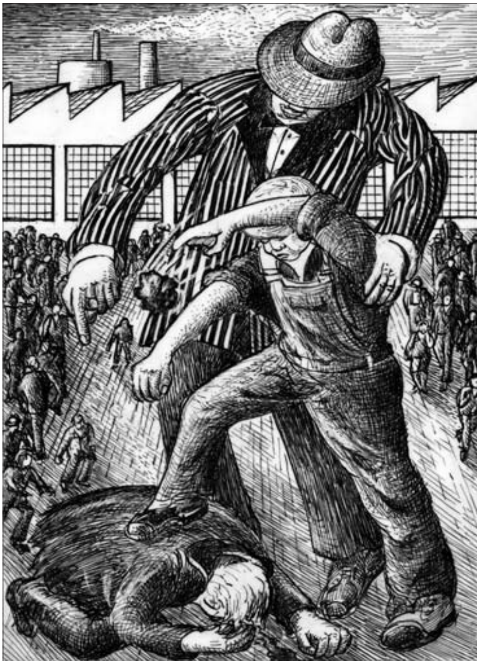
Teilen und herrschen