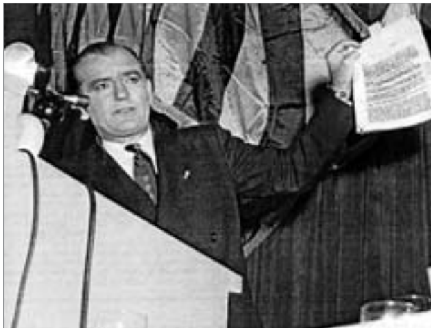
Senator Joe McCarthy schwenkt eine seiner infamen Listen.