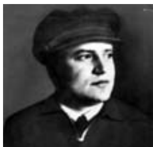
Willi Bredel mit Hamburger Arbeitermütze, um 1930

Während Bredel aus Frankreich in die UdSSR übersiedelte, hatte sich Weiskopf mit seiner Frau Grete, die später unter dem Pseudonym Alex Wedding in der DDR vielbeachtete Bücher schrieb, für die Emigration in die USA entschieden. Vergeblich bemühte er sich dort um die Herausgabe Bredelscher Bücher. Er mußte sich aber auf Rezensionen in einer renommierten Literaturzeitschrift beschränken.