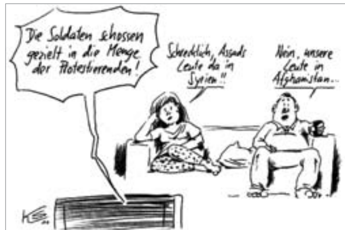
Karikatur: Klaus Stuttmann

Syrien, dessen Bevölkerung ein Mosaik vieler Nationalitäten und Glaubensbekenntnisse bildet, ist aus historischen Gründen und wegen seiner strategischen Lage als Brücke zwischen Europa, Asien und Afrika das Schlüsselland des Nahen