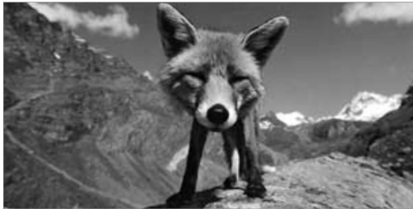
Diese uns zugesandte Karte trägt auf der Rückseite folgenden Text: „Mit aufgestellten Lauschern horcht der Rotfuchs auf das Pfeifen der Murmeltiere.“ Wie wahr!

westdeutschen FDJ am 1. Oktober 1950 eine ähnliche Veranstaltung im Ruhrgebiet durchzuführen. Ja, wir trauten es uns sogar zu, für ein Treffen von 100 000 jungen Bundesbürgern zu werben. Damit wollten wir der Welt zeigen, daß es auch