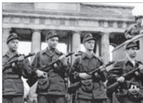
Genossen der Kampfgruppen der Arbeiterklasse am Brandenburger Tor

Bis zum 13. August 1961 standen allen Bürgern der DDR angesichts einer zwar markierten, aber nicht verschlossenen Grenze zu Westberlin zwei symbolische Türen offen. Die Wege dahinter führten zu diametral entgegengesetzten Zielen. Alle vor diese Wahl Gestellten konnten sich zwischen einer ausbeutungsfreien, aber noch von den Narben des Alten gezeichneten und mit den sich türmenden Schwierigkeiten des Anfangs ringenden sozialistischen Gesellschaftsordnung und dem wie Phönix aus der Asche der Niederlage gestiegenen deutschen Kapitalismus entscheiden.