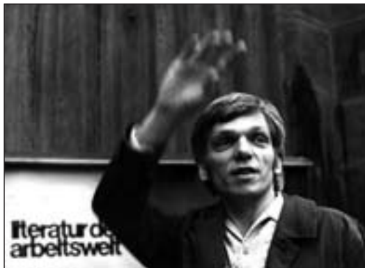
Auf der 2. Delegiertenversammlung des Werkkreises in Mannheim (November 1970)

Frankfurt/Main, doch gab es „nach dem optimistischen Aufbruch keine kontinuierliche Aufwärtentwicklung“. So steht es in „Literatur an der Basis: Kollegen schreiben für Kollegen“. Grenzen setzen den Schreibenden deren harter Produktionsalltag und andere äußere, kapitalismusgemachte Hemmnisse, gezeigt zum