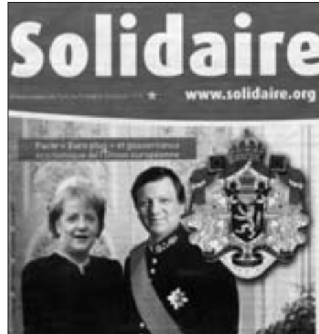
„Sind Merkel und Barroso die neuen Regenten Belgiens?“ fragt die Brüsseler Wochenzeitung „Solidaire“ auf ihrer Titelseite

Menschen in den Partnerländern, daß sie sich künftig mit weniger Urlaub, weniger Lohn und einem späteren Renteneintrittsalter abfinden. Ihre Forderungen sind von nationalistischen