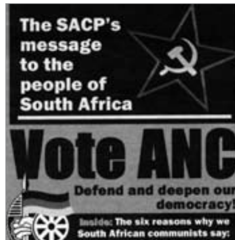
Aufruf der SACP, für den ANC zu stimmen

Klassenpositionen zutage. Es fehlt nicht an jenen, welche gezielt auf eine Zerschlagung der Dreierkoalition hinarbeiten. Sie untergraben die schwer erkämpften demo-