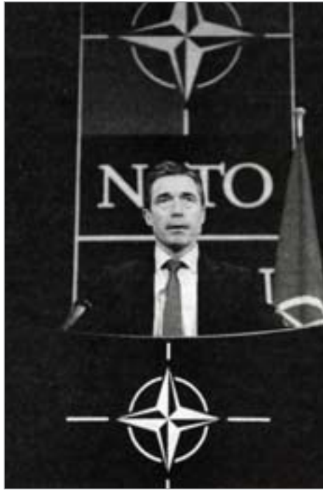
Führt die Bombenwerfer in Libyen an: NATO-Generalsekretär Rasmussen

Dinar (etwa 50 000 US-Dollar). Es gibt zinsfreie staatliche Darlehen ohne Rückzahlungsfrist. Aufgrund von Regierungssubventionen sind die Preise für Autos