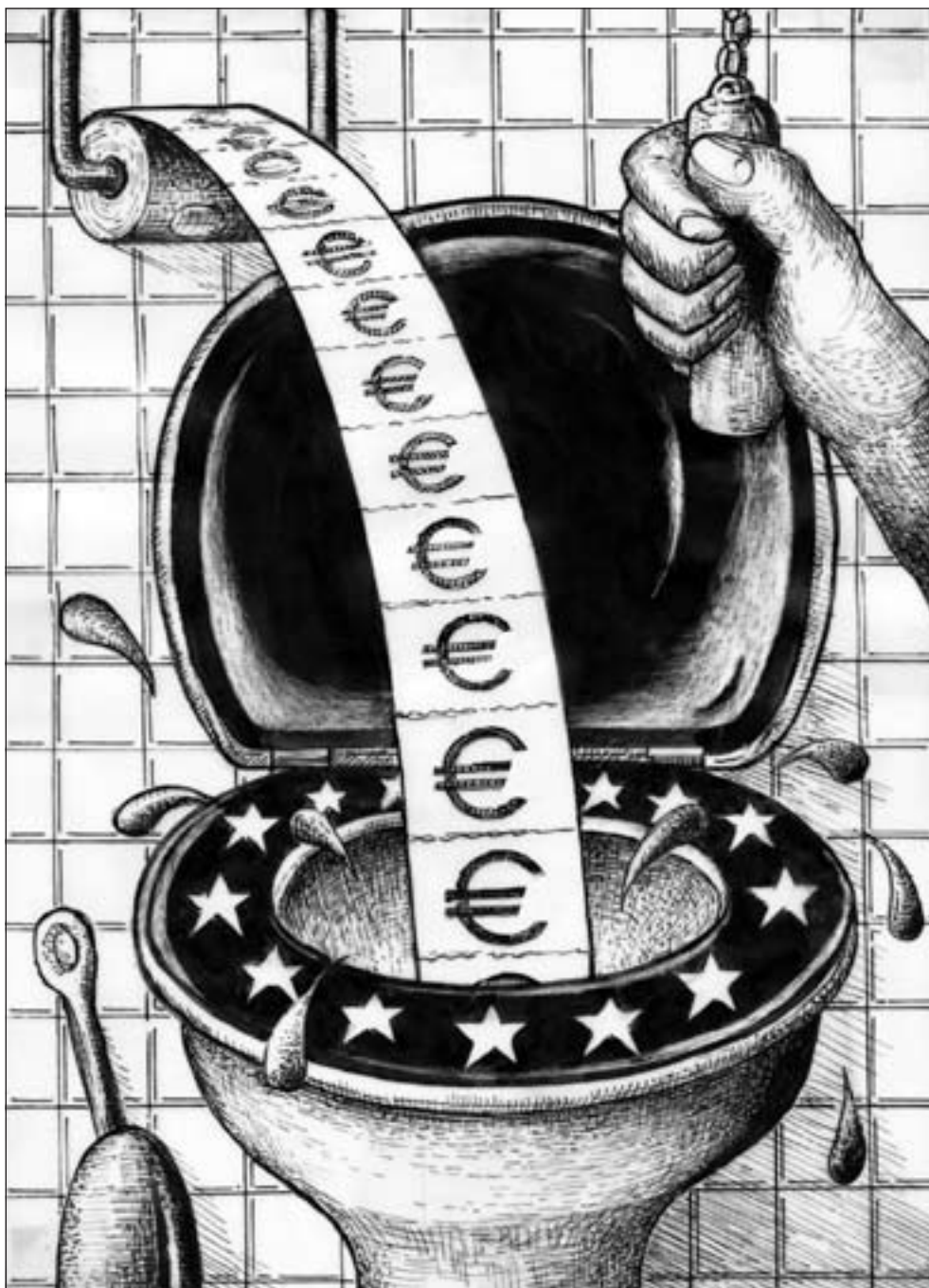
Der Kurs des Euro