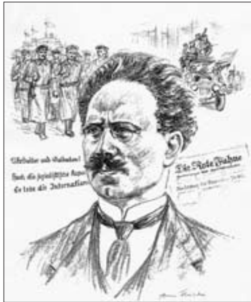
Grafik: Arno Fleischer

Schlachtschiffe zur Niederwerfung des Aufstandes, die Erhöhung der Truppenstärke und schließlich die Finanzierung der Aggression erfolgten verfassungswidrig ohne vorherige Budgetbewilligung seitens des Reichstages. Das Beste wäre es, meinte Liebknecht, wenn bei Beginn sei-