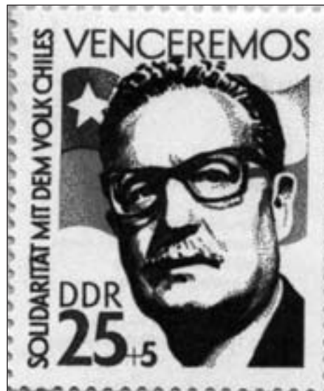
Briefmarke der DDR von 1973

Zu den im Vestibül des Hauses aufgestellten Stelen mit den Namen der Länder, in denen nach dem Ende blutrünstiger Dik-