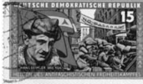
Briefmarke der DDR von 1966

Adolf Hitler wurde im gleichen Monat zum alleinigen Führer der noch jungen NSDAP gewählt und in Italien Mussolini erneut zum Duce ernannt.