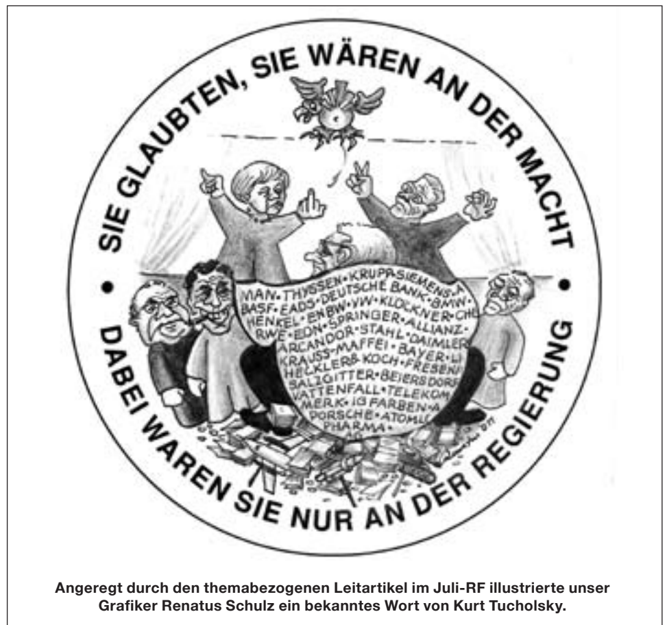
Angeregt durch den themabezogenen Leitartikel im Juli-RF illustrierte unser Grafiker Renatus Schulz ein bekanntes Wort von Kurt Tucholsky.