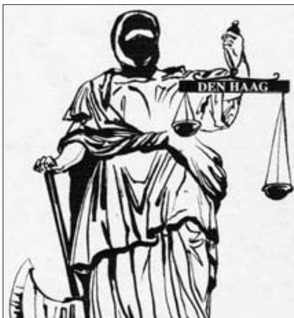
Grafik von SHAHAR

albanischen UCK. Zwei Monate führte die NATO unter direkter Mitwirkung der die Tradition von Mölders und seiner Legion Condor fortsetzenden Bundesluftwaffe massive Schläge gegen Serbiens Infra-