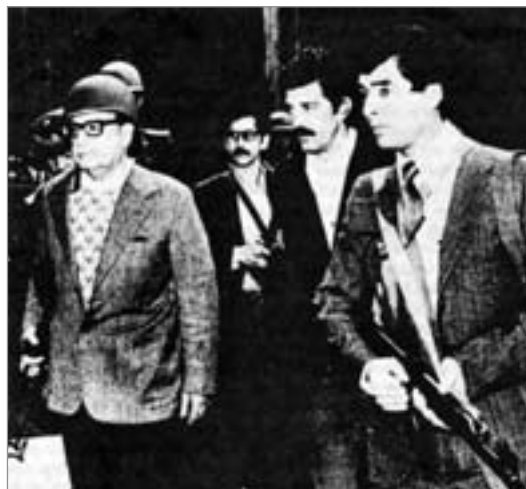
Präsident Allende mit seinen Genossen am 11. September 1973 in der Moneda von Santiago de Chile

Am Mittag begann der Angriff aus der Luft. Die beteiligten Maschinen rasten im Tief-