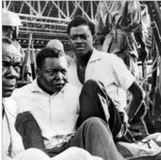
Kongos erster Premierminister Patrice Lumumba (rechts), Jugendminister Mpolo (links) und Senatsvizepräsident Joseph Okito kurz vor ihrer Ermordung in Katanga

3 Millionen Stimmen zu zweifeln wagten, gab sich Tshisekedi seinerseits als Gewinner aus. Er bezeichnete das bekanntgegebene Resultat als gefälscht, erklärte sich selbst zum Präsidenten und bat die „internationale Gemeinschaft“ – gemeint waren seine imperialistischen Schirm-