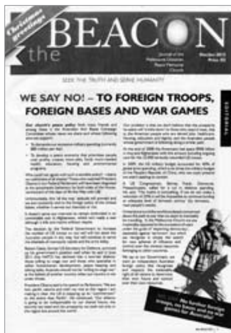
Reproduktion der Titelseite von „the Beacon“

Zunächst ein Wort zu den Unitariern, die in den USA und anderswo über zahlreiche Anhänger verfügen. Bei dieser Glaubensgemeinschaft, die zu einer historischen Interpretation der Christus-Legende tendiert, handelt es sich mehrheitlich um Verfechter klar umrissener sozialer Ziele, vor allem aber um entschiedene Kriegsgegner. „Die Wahrheit suchen und der Menschheit dienen“, heißt das Motto unserer Freunde von der Melbournen Friedens-Gedächtniskirche. Die hier reproduzierte Titelseite des „Beacon“ steht unter der Schlagzeile „Wir sagen nein zu ausländischen Truppen, fremden Stützpunkten und Kriegsspielen!“ Damit distanziert sich das Blatt der Unitarier des fünften Kontinents nachdrücklich von der Forderung des USA-Präsidenten Barack Obama, der im vergangenen Herbst Australien besucht und vor dem Bundsparlament erklärt hatte: „Wir sind zwei pazifische Nationen ... und ich möchte hier klarmachen, daß die Vereinigten Staaten ihr Engagement für den gesamten pazifischen Raum aufstocken werden ... Unsere Allianz ist unverzichtbar.“ „the Beacon“