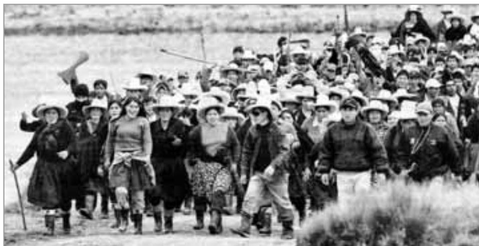
Am 31. Mai begann in der Region Cajamarca ein unbefristeter Generalstreik.

taler Repression gewesen ist, habe sich ein politischer Erdbeben vollzogen, lautete damals der Tenor vieler Kommentare. Hinter den über Nacht zum Staatschef aufgestiegenen Favoriten eines breiten politischen Spektrums stellte sich nicht nur die gemäßigte Linke. Auch die kampferfahrene Peruanische KP sicherte dem Wahlsieger ihre volle Unterstützung zu.