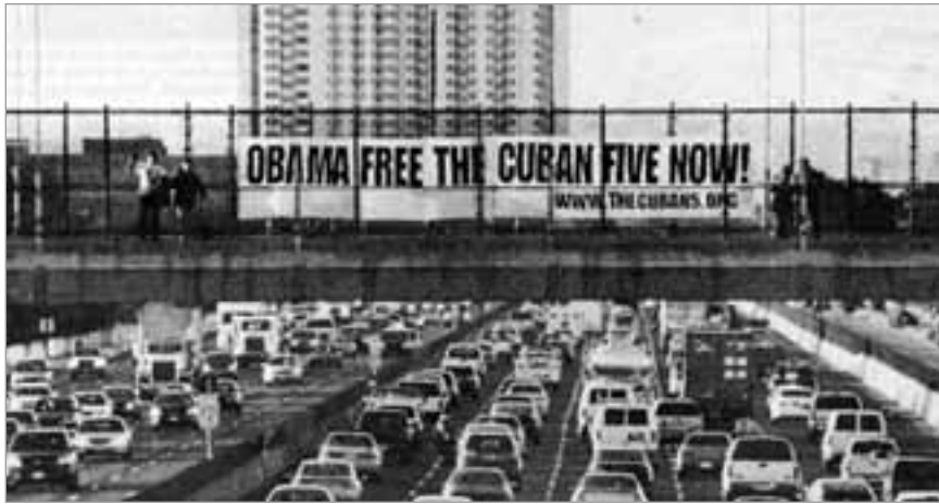
Spruchband über einem der befahrensten Highways in der Region von San Francisco

entsprechende Maßnahmen zur Vereitelung von den Exilkubanern geplanter Anschläge ergreifen konnte. Während das „Bureau“ in dieser Hinsicht nichts unter-