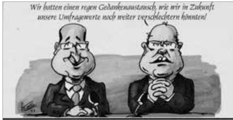
Hollande und Steinbrück auf einer Couch