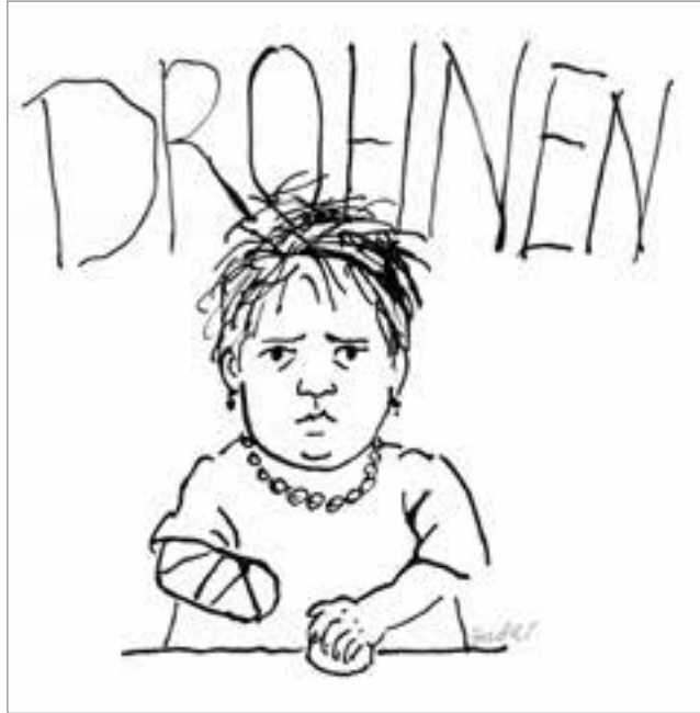
Zum Internationalen Kindertag am 1. Juni, der einmal mehr im Zeichen des Kampfes gegen den Krieg und dessen furchtbare Folgen für die kleinen Erdenbürger steht, gestaltete Gertrud Zucker diese anklagende Grafik.

eigenen Systems ächzen und wanken, ist ein solches Vorgehen nur logisch. Einstweilen rechnet man wie bisher damit, daß hinreichend viele Menschen hinter dem Alltagsgeschehen, so manchem Komfort und persönlichen Sorgen