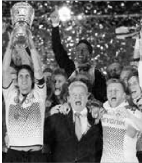
Der brüllende Mann in der Mitte war der „Stasi“-Wahn-Einpeitscher Nr. 1

bisherige Auseinandersetzung mit dem DDR-Unrecht trage schwere Mängel. Man habe den Staatssicherheitsdienst ‚dämonisiert‘, ein Bild vom Geheimdienst geschaffen, welches ‚mit der Realität nichts gemein‘ habe. ... Mit dem ‚Label IM‘ seien Menschen zu Inoffiziellen Mitarbeitern gemacht worden, ‚als wenn sie