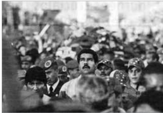
Als der Sarg von Chávez durch die Straßen von Caracas zum Militärmuseum geleitet wurde, folgten ihm Zehntausende Venezolaner. In der Mitte sein Nachfolger Nicolás Maduro und (links von ihm) Boliviens Präsident Evo Morales.

Als Kandidat der rechtsgerichteten Vereinigten Demokratischen Bewegung (MUD) zog Henrique Capriles Radonski, Gouverneur des Bundesstaates Miranda, alle Register der Demagogie und Irreführung. Der einstige Wortführer einer faschistoiden Partei und Sproß einer der