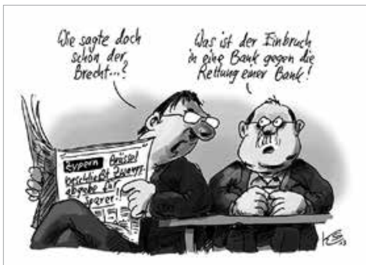
Karikatur: Klaus Stüttmann

Million Einwohner zählenden Landes ins Auge gefaßt worden. Im Parlament wagte es dann allerdings nicht einmal mehr die DISY-Fraktion, diesem beispiellosen Griff in die Taschen des kleinen Mannes zuzustimmen. Während AKEL-Demonstranten mit ihrer massiven Anwesenheit die Forderung nach einem ablehnenden Votum unterstrichen, stimmte selbst die Regierung gegen das von ihr zunächst akzeptierte Brüsseler Verlangen. So wurde nachverhandelt. Am Ende einigte man sich darauf, nur Konten über 100 000 € in diese Sonderabgabe einzubeziehen, womit man auch den „reichen Russen“ ein Bein stellen will.