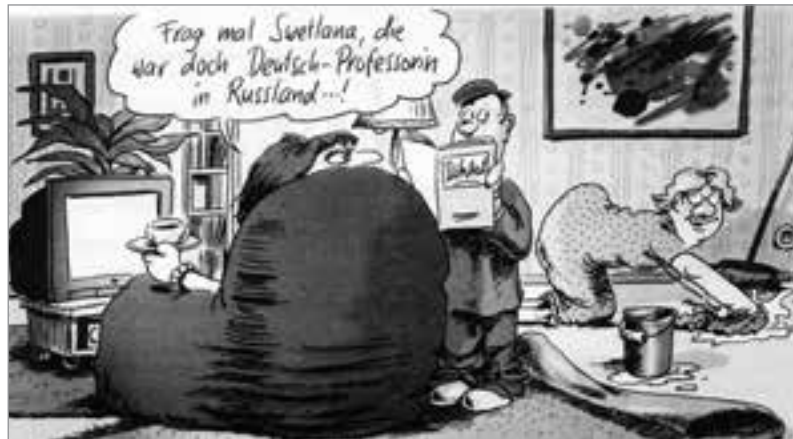
Karikatur: Klaus Stüttmann

über ein Land berichtet, das einst von den Panzerketten der Nazi-Wehrmacht überrollt worden war und im Osten lag, geschah das meist mit einem Unterton hochmütiger Herablassung und gönnerhaften Mitleids. Ach ja, die Russen sind eben so – oder – die Polen packen es ohnehin nicht. Selbst in der DDR konnten nationali-