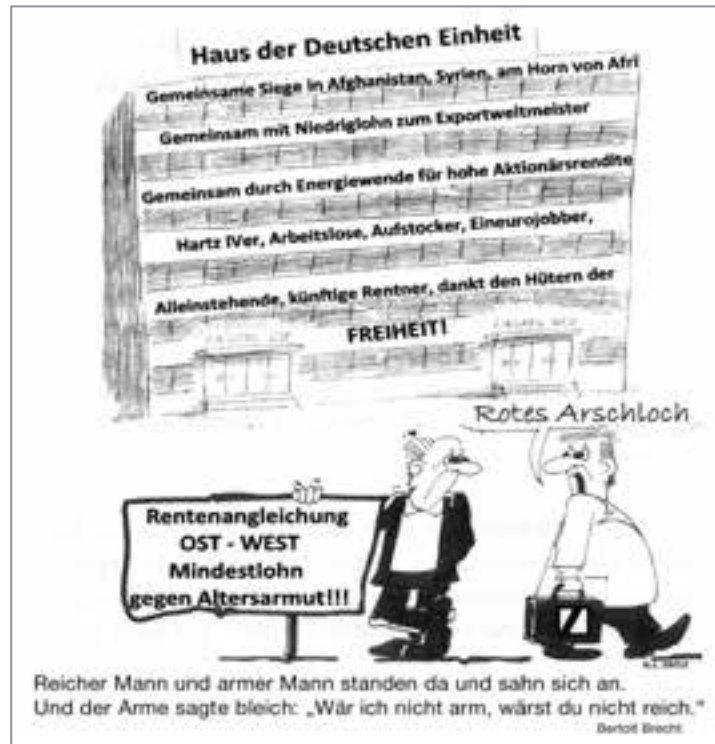
Collage: G. L.

gen, betreibt inzwischen ungeniert und mit alter Dreistigkeit die Ausbeutung der Menschen anderer Völker und mischt bei der imperialistischen Neuaufteilung der Welt nach Kräften mit.