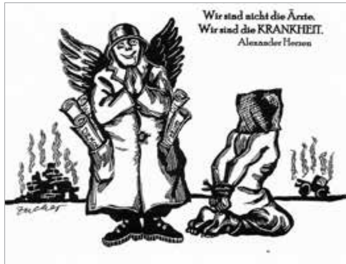
Grafik: Gertrud Zucker

RF, gestützt auf „The Guardian“, Sydney, „GlobalResearch“, Kanada