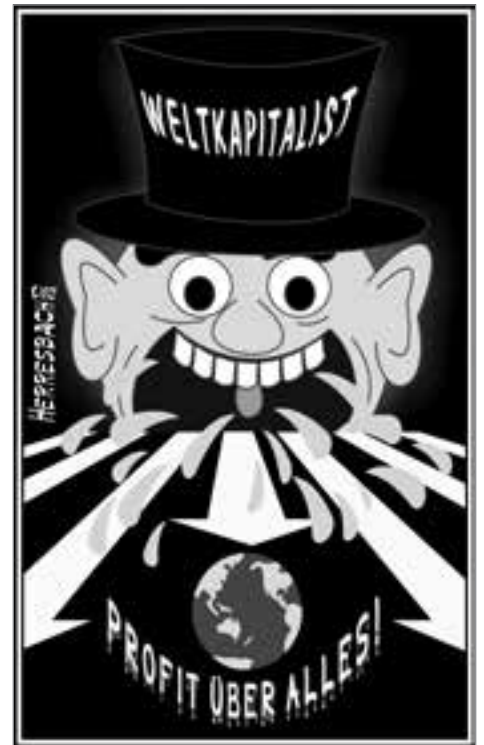
Cartoon: Heinz Herresbach