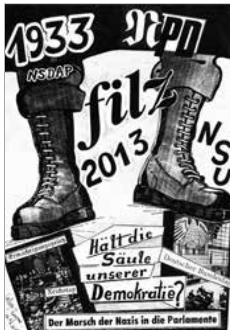
Collage: Heinrich Ruynat

scheinbar populärwissenschaftliche Sendungen wie ZDF-History und BBC-