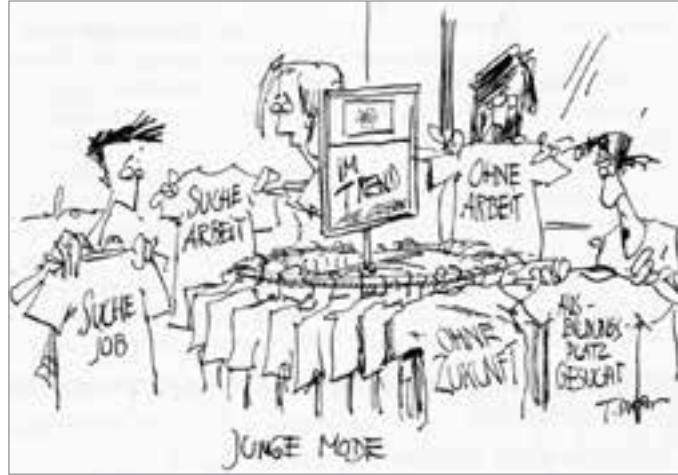
Karikatur: Thomas Plassmann (ver.di NEWS)

„Das ist halt der Zeitgeist“, meinte der sächselnde Hotelbetreiber. Er hatte in