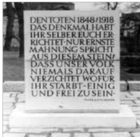
Der Stein des Anstoßes auf dem Friedhof der Märzgefallenen