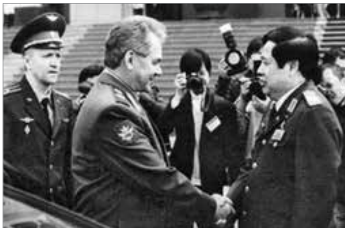
Rußlands Verteidigungsminister Shojgu bei der Begegnung mit seinem vietnamesischen Amtskollegen Phung Quang Thanh in Hanoi

Wohl nicht ganz zufällig war die erwähnte Schwarzmeerübung, an der 7000 Angehörige russischer Spezialeinheiten, vor allem Marine-Infanteristen und Fallschirmjäger, teilnahmen, unmittelbar nach der Ankündigung einer noch