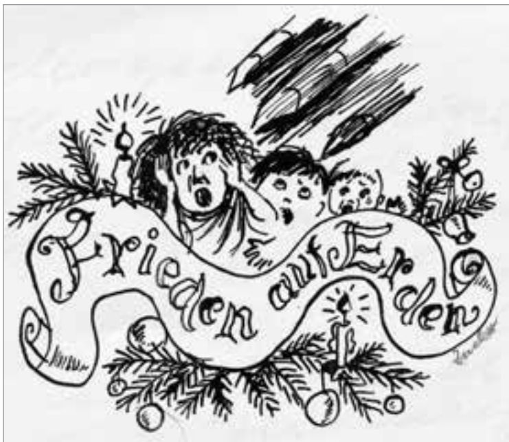
Grafik: Gertrud Zucker

Wenn man allerdings sämtliche Kriege der USA betrachtet – ist da seit Aufkün-