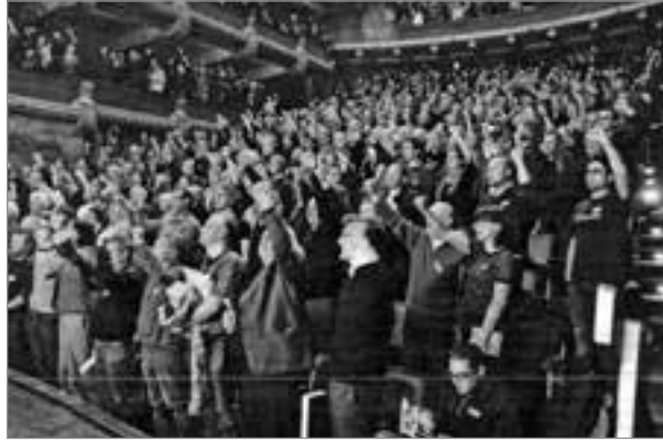
Widerstand gegen Bart de Wevers N-VA: Die „Internationale“ und geballte Fäuste im Umfeld der durch die Rechte regierten flandrischen Metropole Antwerpen beim „3. Tag des Sozialismus“

Das Ziel auch der dritten Veranstaltung bestehe darin, angesichts der tiefgreifen-