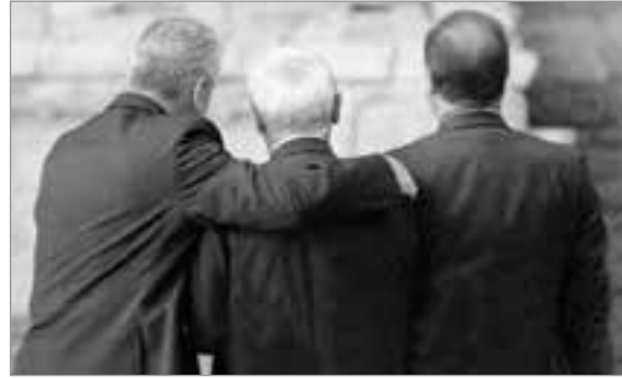
In Begleitung des rechtssozialdemokratischen Staatspräsidenten François Hollande macht BRD-Präsident Gauck im Umgang mit dem letzten Überlebenden des SS-Massakers im französischen Oradour-sur-Glâne einmal mehr auf Mitgefühl.

Gauck bezeichnete es als „grobes Unrecht“ der Kommunisten, 1950 die Grenze an Oder und Neiße als neue deutsch-polnische Staatsgrenze anerkannt zu haben. Eine Großtat für den Frieden – die Versöhnung mit Polen – fälschte der Kirchenmann in ihr Gegenteil um. Daß eine Inquisitionsbehörde mit seinem Namen für kurze Zeit