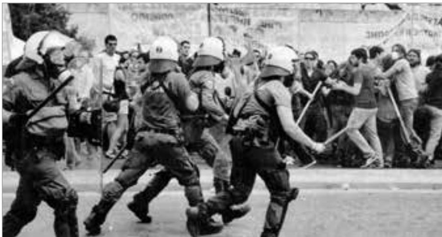
Die Athener Polizei, der selbst etliche Aktive der „Goldenen Morgendämmerung“ angehören, schützt Griechenlands Braune und geht gegen Rote mit äußerster Härte vor.

Doch wir haben es keineswegs nur mit wirtschaftlicher Verwerfung zu tun. Die politische Krise der griechischen Gesellschaft ist nicht minder gravierend. Die drastische soziale Polarisierung führt zur Verschärfung der Widersprüche. Gewalttätige Übergriffe auf Linke und andere Antifaschisten sowie brutalster Polizeiterror zum Schutz rechtsradikaler Banden sind