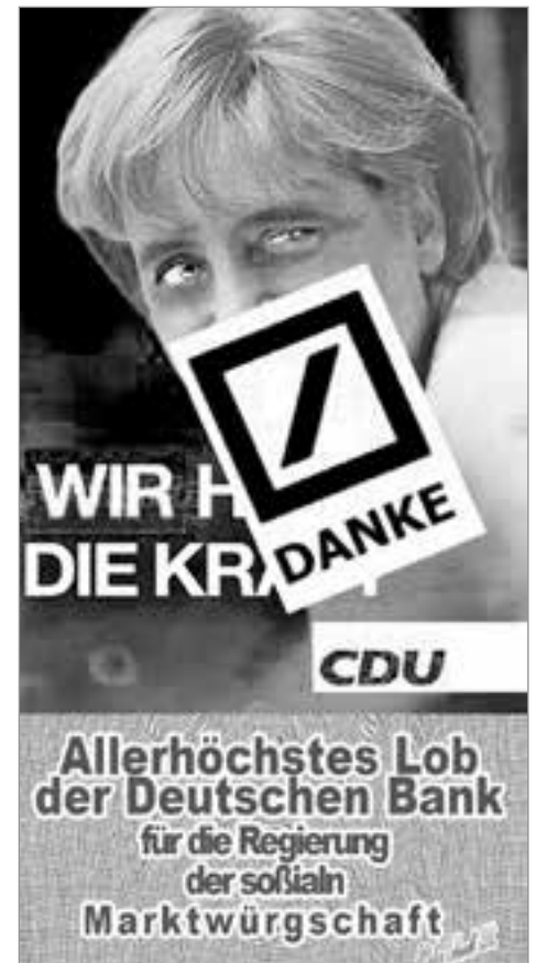
Collage: Dieter Eckardt