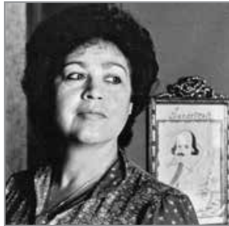
Die Schriftstellerin in jüngeren Jahren (1978)