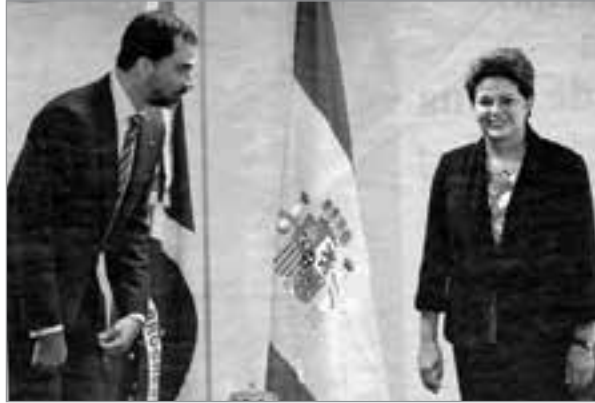
Der Bourbonen-Sproß und die einstige Guerilla-Kämpferin: Spaniens Kronprinz Felipe und Brasiliens Präsidentin Dilma Rousseff bei einer Audienz im Präsidensitz von Brasília