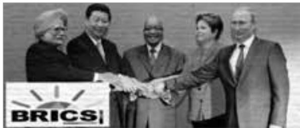
Bündnis gegen die Vorherrschaft der USA und der EU: Auf dem Gipfeltreffen von BRICS reichten sich die Repräsentanten Indiens, Chinas, Südafrikas, Brasiliens und Rußlands die Hände.

Nach BRICS – der aus Brasilien, Rußland, Indien, China und Südafrika bestehenden