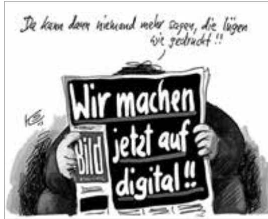
Karikatur: Klaus Stüttmann

die neue Polizei in Ost- und Westdeutschland völlig konträre soziale und politische Konturen besaß. Sollte Schulze etwa entgan-