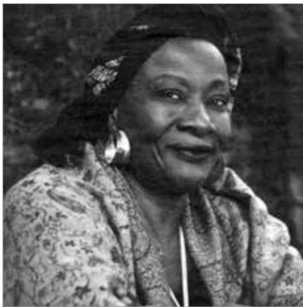
Aminata Traoré: „Mali ist Frankreichs Afghanistan.“

Unter dem Vorwand, die Einheit und territoriale Integrität des Landes gegen im Norden befindliche Angehörige des Noma-denstammes der Tuareg und radikale