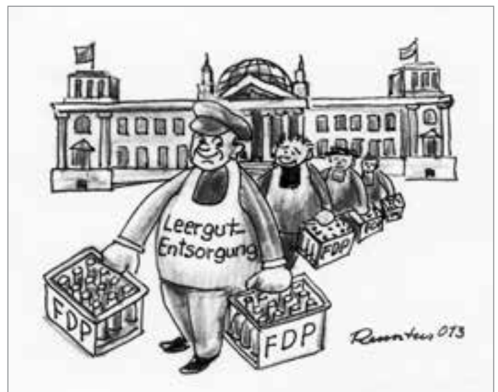
Karikatur: Renuatus Schulz