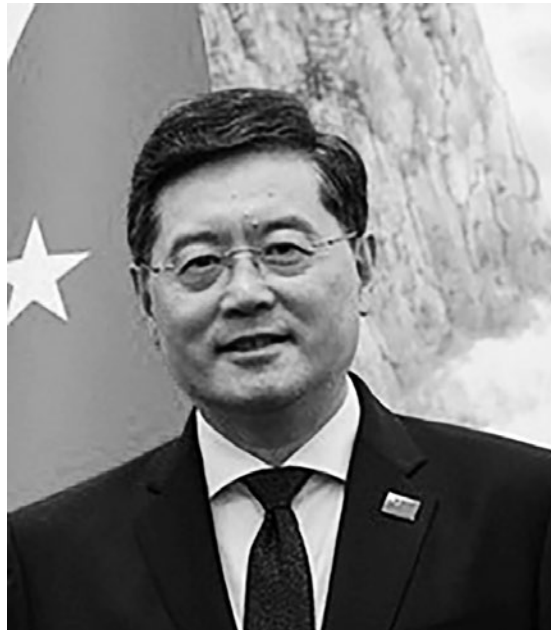
Der chinesische Außenminister Qin Gang

Es gibt einen Satz aus George Orwells „1984“: „Wer die Vergangenheit kontrolliert, kontrolliert die Zukunft; wer die Gegenwart kontrolliert, kontrolliert die Vergangenheit.“ Es galt