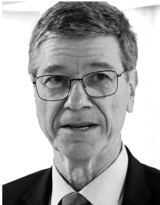
Jeffrey D. Sachs: Dieser Krieg wurde provoziert

Am 20. Mai geriet Bakhmut unter die Kontrolle von Wagner-Einheiten. Die ukrainischen Streitkräfte (SK) mußten sich aus allen befestigten Gebieten in die Flanken Bakhmuts und später auch daraus zurückziehen. Die Gesamtzahl der ukrainischen SK in der Stadt und an den Flanken stieg nach dem Rückzug aus Soledar und der Überführung von Reserven auf ca. 100 000 Mann.