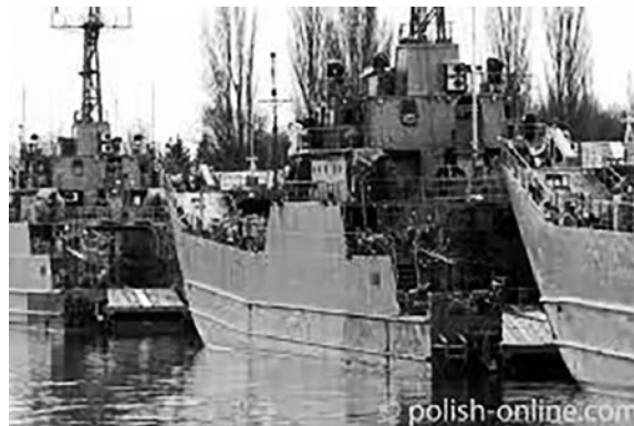
Seit 2010 im NATO-Plan für den Krieg gegen Rußland: Kriegshafen Swinoujscie in Polen

Kriege mit Rußland ausheckten. Seit dem Zusammenbruch der UdSSR hat sich daran nichts geändert. Im Jahr 2010 entwarfen NATO-Generäle ein Kampfprogramm für die