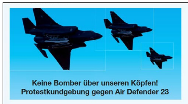
Wir brauchen eine Zeitenwende für Frieden und Abrüstung! Nein zum NATO-Manöver „Air Defender 2023“

schrieb der junge, radikaldemokratische Karl Marx: „Ja, die deutsche Geschichte schmeichelt sich einer Bewegung, welche ihr kein Volk am historischen Himmel weder vorgemacht hat noch nachmachen wird. Wir haben nämlich die Restaurationen der modernen Völker geteilt, ohne ihre Revolutionen zu teilen. Wir wurden restauriert, erstens, weil andere Völker eine Revolution wagten, und zweitens, weil andere Völker eine Konterrevolution litten, das eine Mal, weil unsere Herren Furcht hatten, und das andere Mal, weil unsere Herren keine Furcht hatten. Wir, unsre Hirten an der Spitze, befanden uns immer nur einmal in der Gesellschaft der Freiheit, am Tag ihrer Bererdigung.“