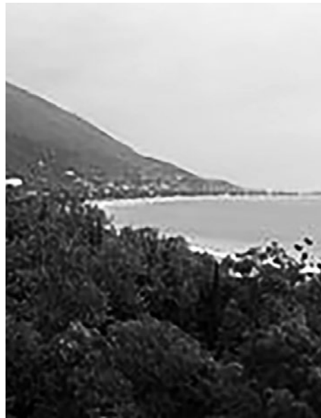
Schwarzmeerküste bei Gagra in Abchasien

Im März 1921 machte die Rote Armee der menschwistischen Regierung der Demokratischen Republik Georgien ein Ende. Noch einmal konnte sich Abchasien aus der ungeliebten georgischen Oberhoheit befreien. Als Abchasische SSR wurde es, ebenso wie die nunmehrige Georgische SSR, Teil der Sowjetunion. Diese Phase der weitgehenden Autonomie währte jedoch nicht lange: Auf Initiative Stalins und Berijas (beide Georgier) wurde die Abchasische SSR 1931 der Georgischen SSR angeschlossen. Gegen diese Maßnahme regte sich Widerstand, der jedoch massiv unterdrückt wurde.