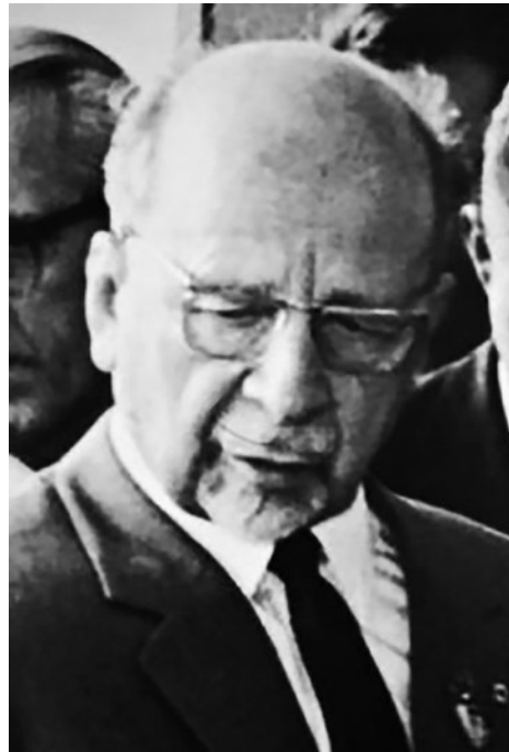
Walter Ulbricht in den 60er Jahren