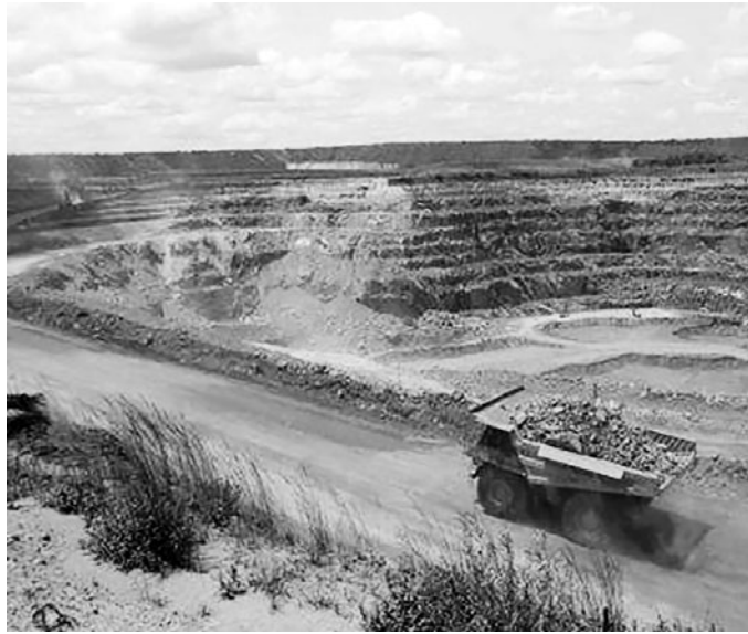
Morila in Mali ist eine der größten offenen Goldminen der Welt. Sie gehört zu 80 Prozent einem in Australien registrierten Konzern.

handwerklichen Goldschürfer in Genossenschaften zusammengefaßt werden. Ein konkretes Beispiel: In dem von dschihadistischen und anderen bewaffneten Gruppen heimgesuchten Grenzgebieten von Burkina-Faso, Mali und Elfenbeinküste werden üblicherweise zehn Prozent der Produktionskosten für Sicherheit kalkuliert, d. h. für „Schutz- oder Lösegelder“. Bereits 2019 mußte den privaten Sicherheitsfirmen für einen den Goldtransport eskortierenden Kraftwagen über 1 500 Euro bezahlt werden. Ein Konvoi benötigt aber mehrere dieser bewaffneten Pick-ups. Ein Hubschrauber kostete das Zehnfache. Ein handwerklicher